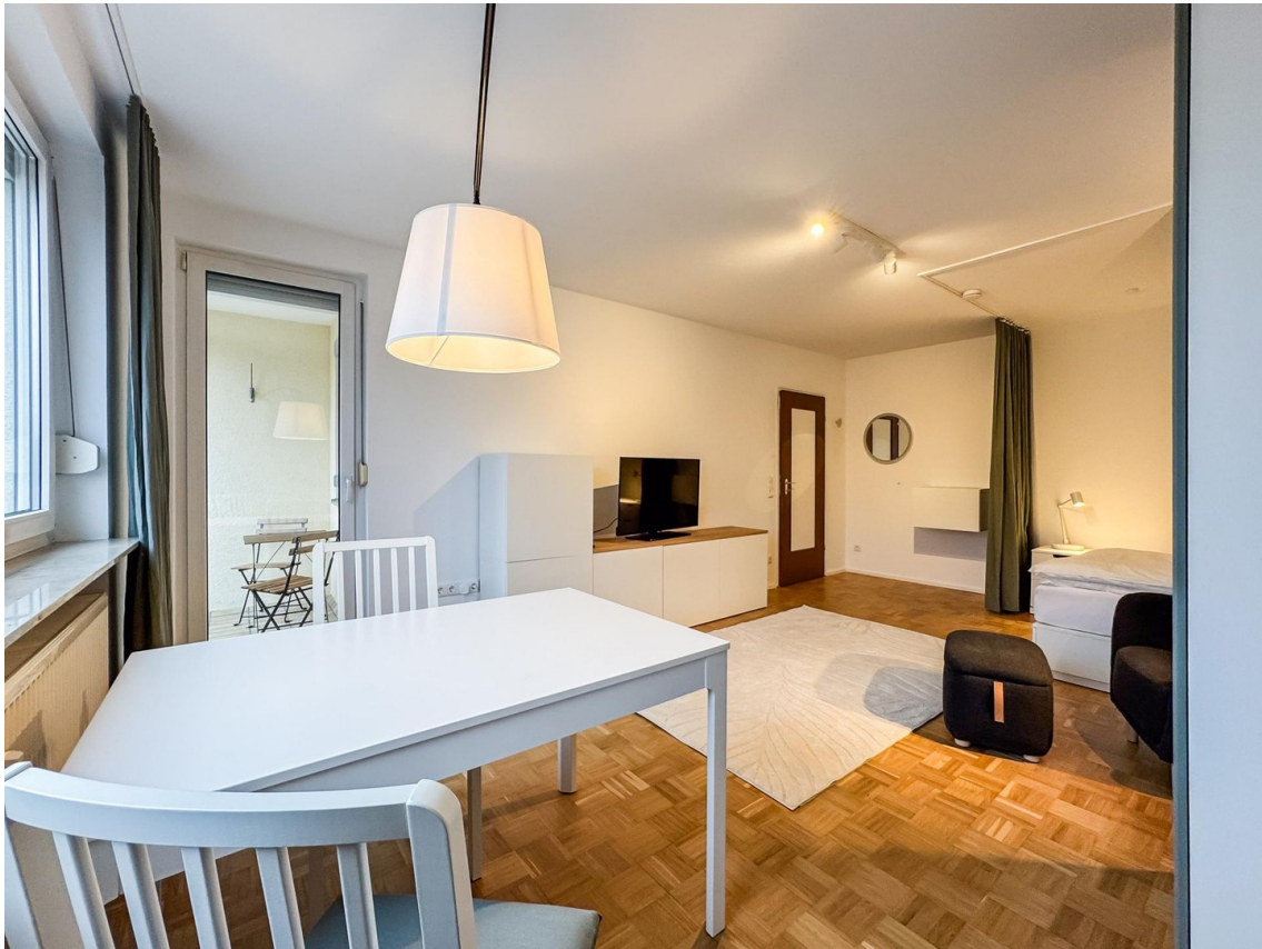
Zimmer 1 - Bild b