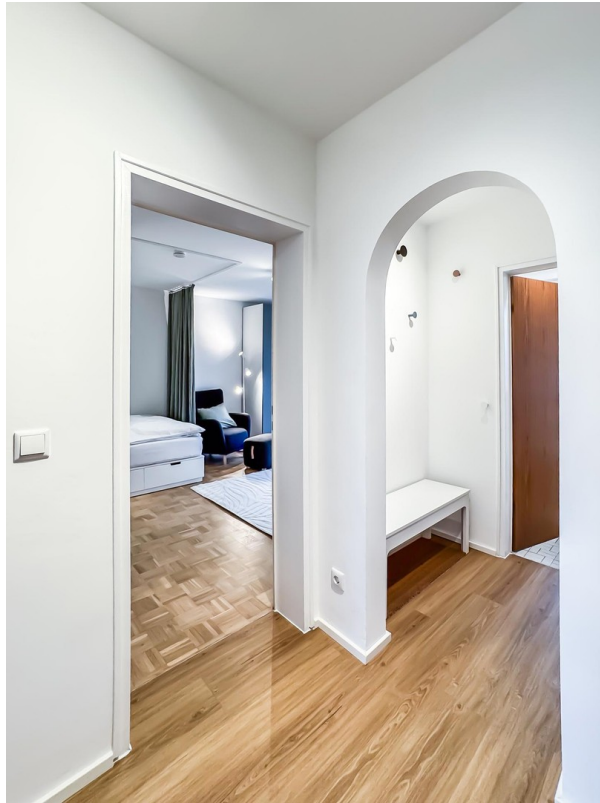
Flur - Bild a