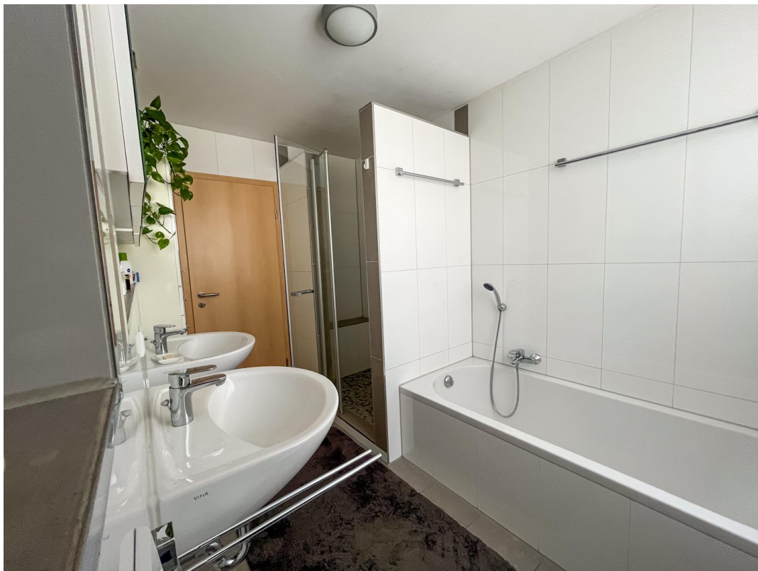
Badezimmer 2. Stock