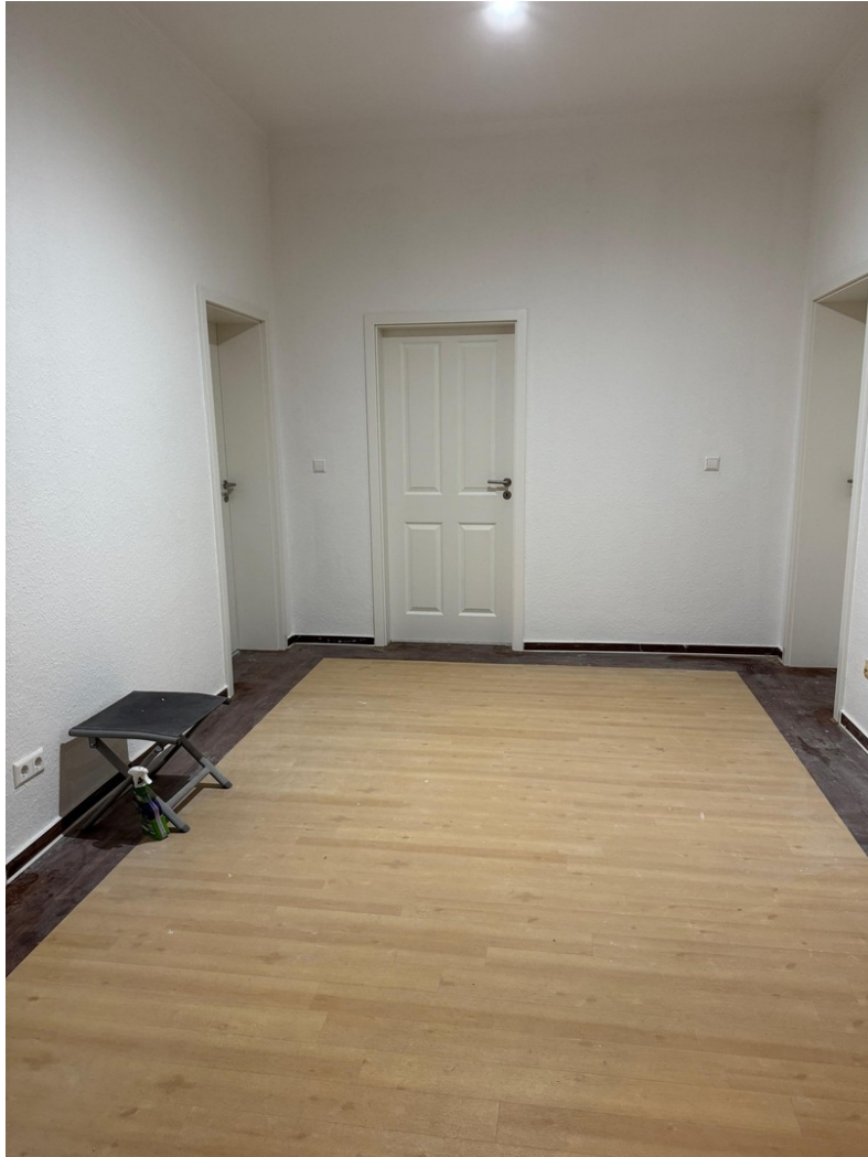
Flur in der Wohnung