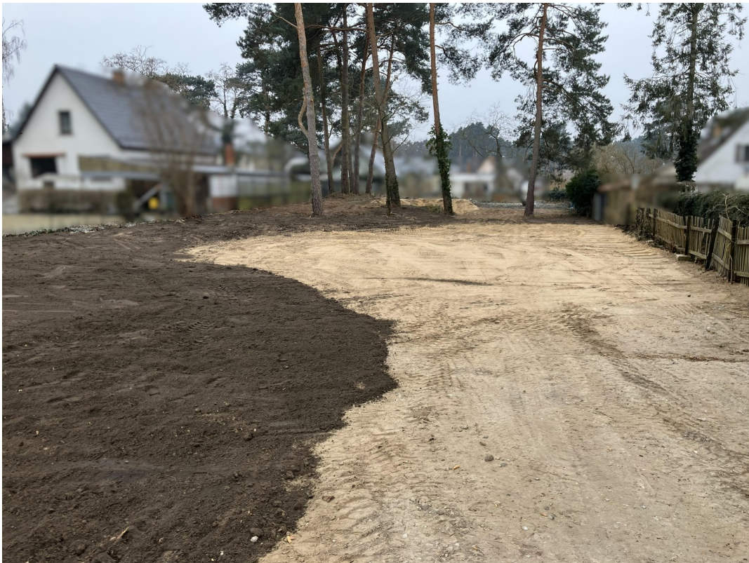
Blick über die Fläche