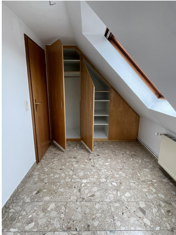
Studio DG mit Einbauschränk