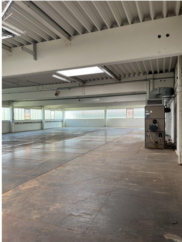
Innenansicht mit Heizung