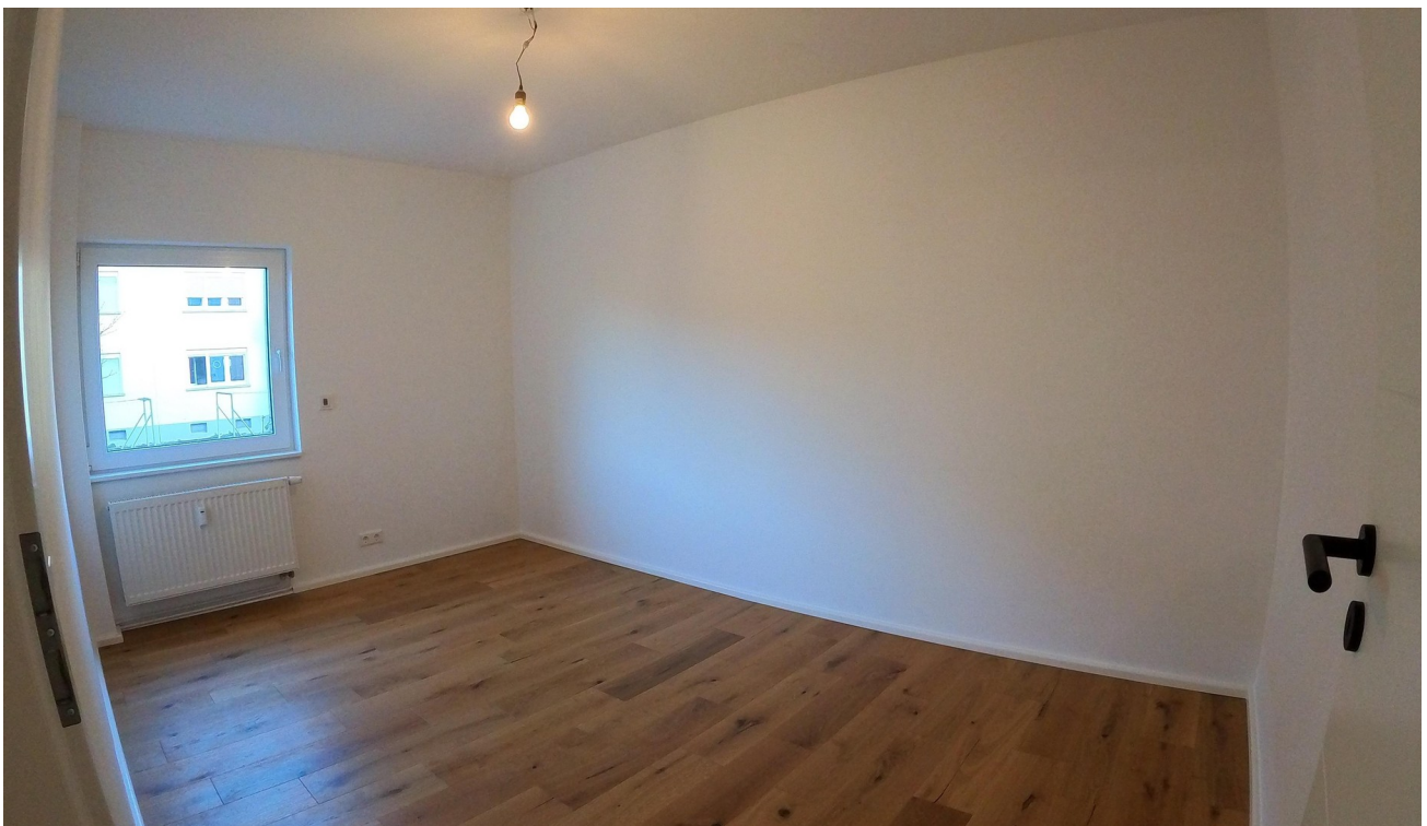
Zimmer flexibel nutzbar