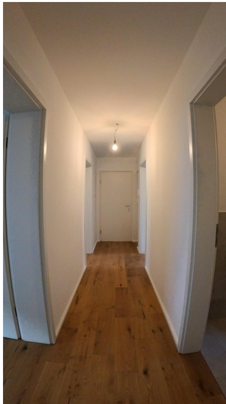
Flur mit Zugang in alle Räumen