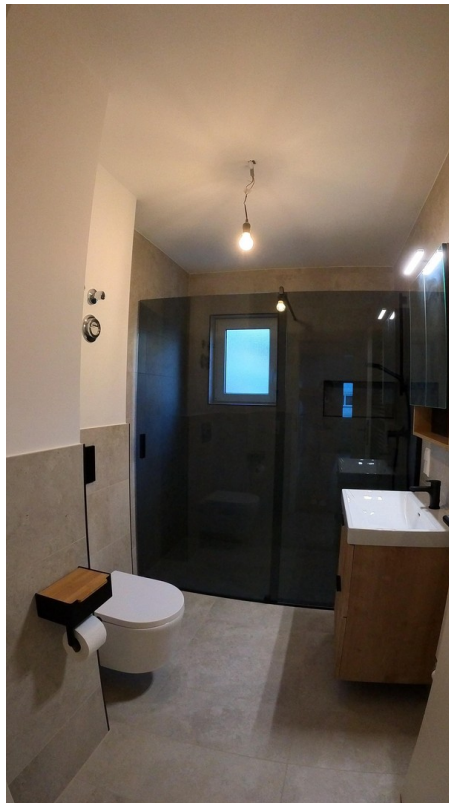
Glas Duschwand schwarz