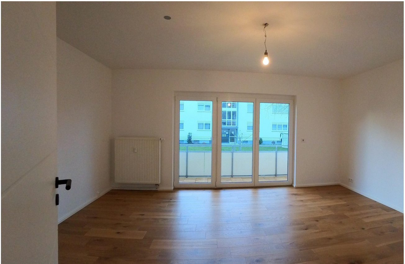
Wohnzi. - große Fensterfront