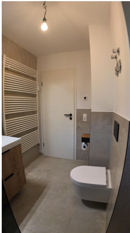
Sicht von der Dusche