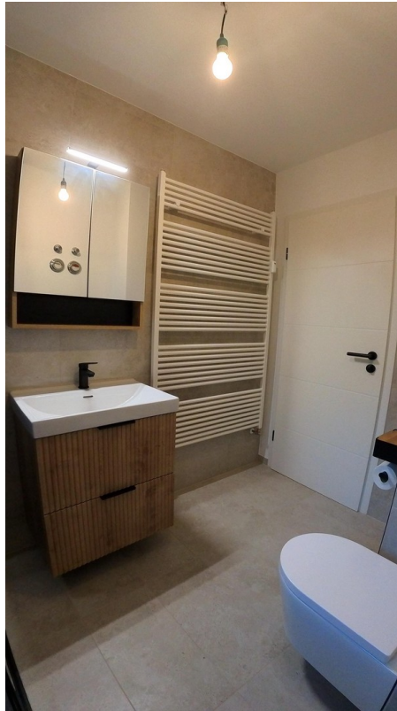
Waschtisch mit Spiegelschrank