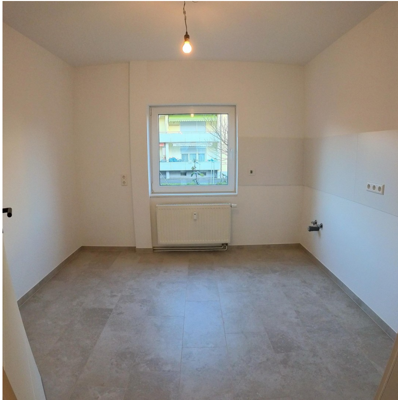
Küche - hell & pflegeleicht