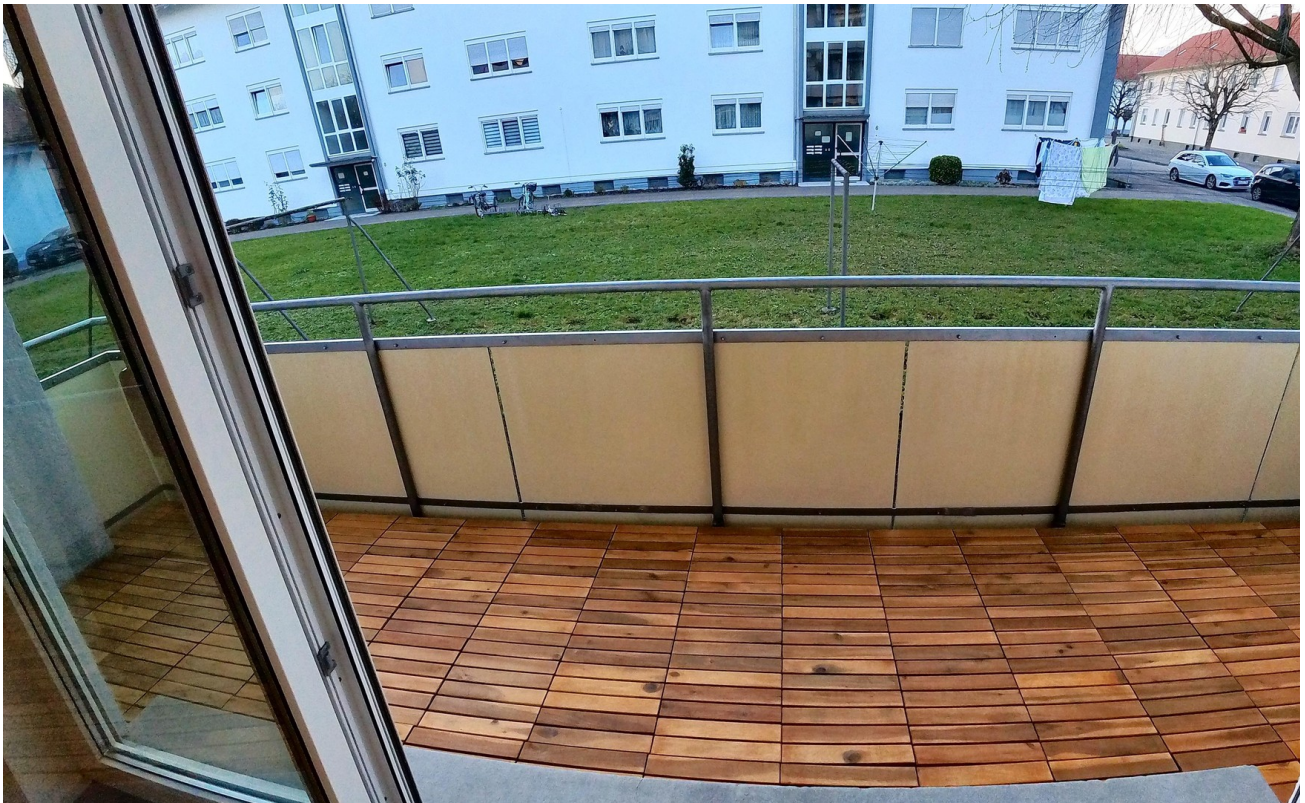
Balkonfliesen Echtholz Akazien