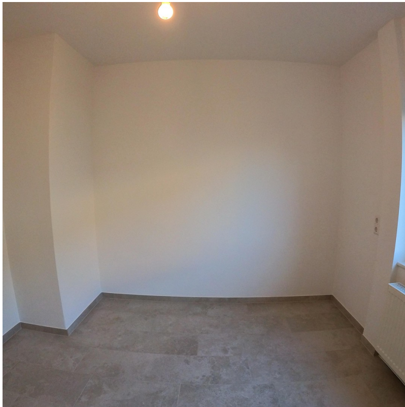
Küche - Essbereich