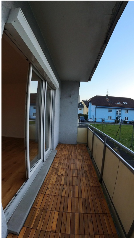
Balkonplatz zum Innenhof