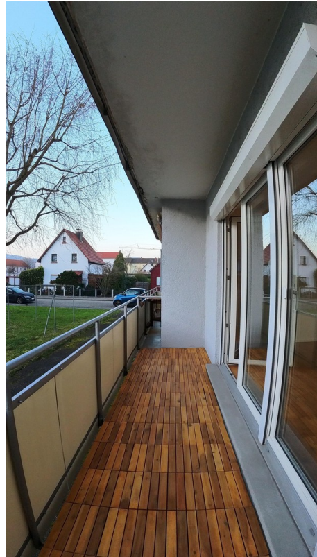
Balkon mit Nachmittagssonne