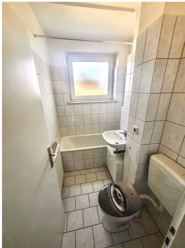
Bad mit Badewanne