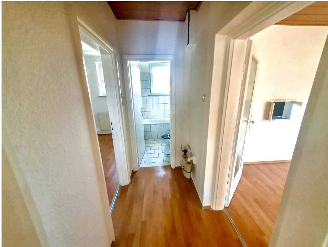
Blick Richtung Bad