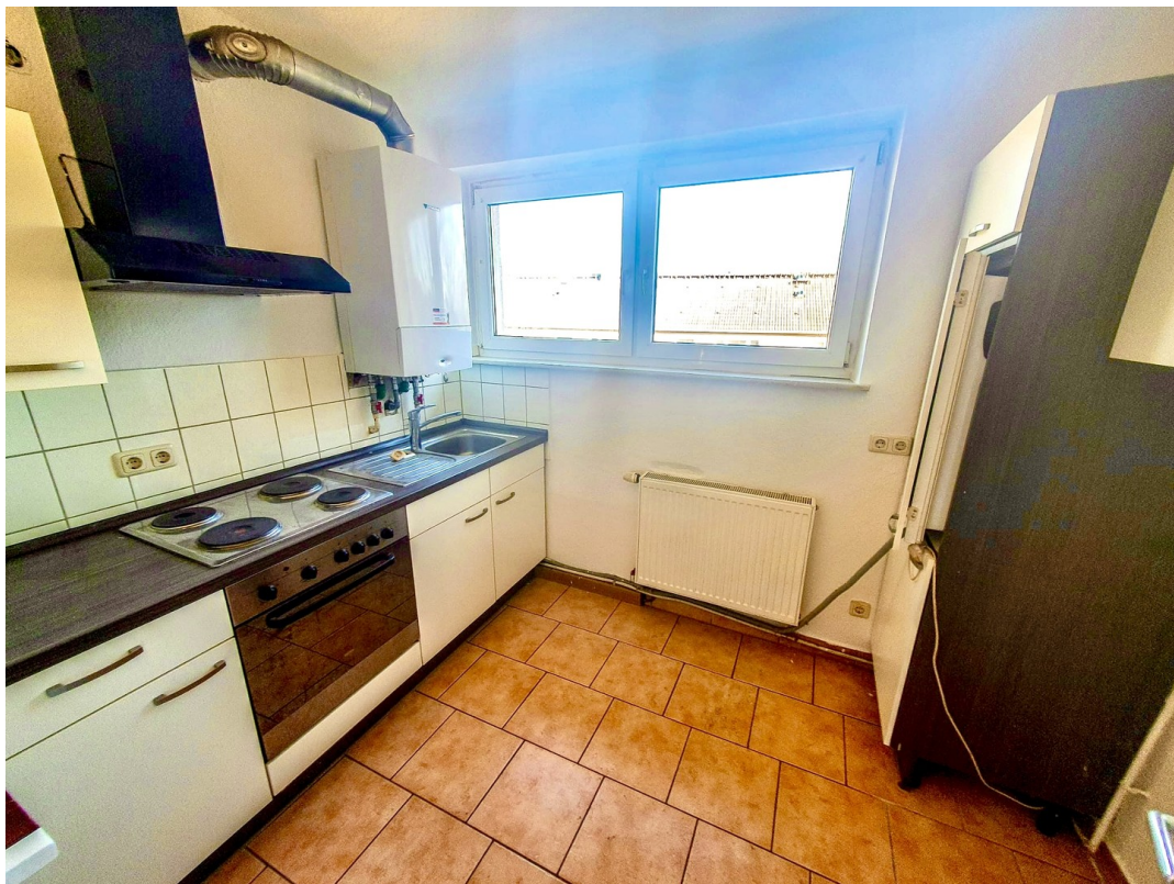
Küche mit Beispiel-Küche