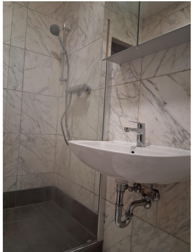
Bad mit neuen Objekten