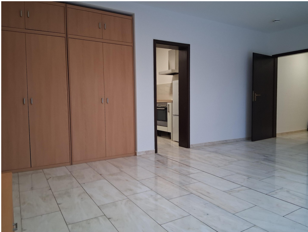
Wohnzimmer Blick zur Küche