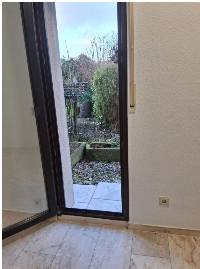
Blick aus dem kl. Schlafzimmer