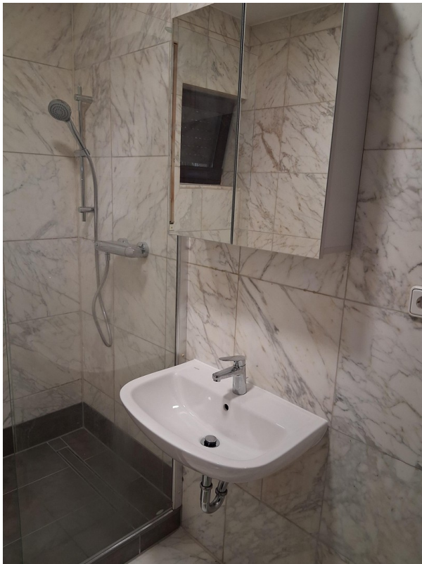
Bad mit walk-in Dusche