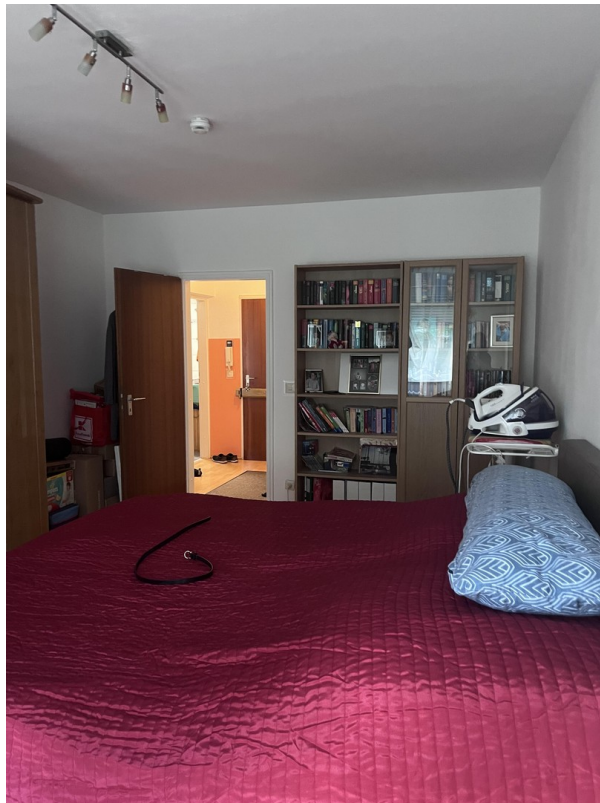
Schlafzimmer mit Flur