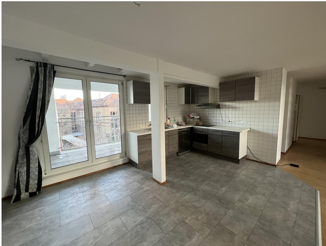
Küche mit überdachtem Balkon