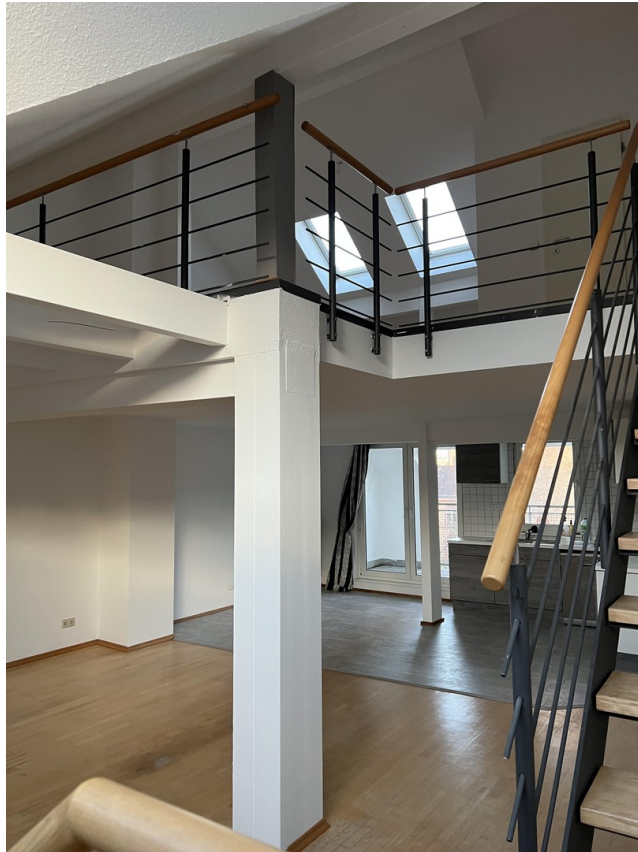
Blick auf Balkon