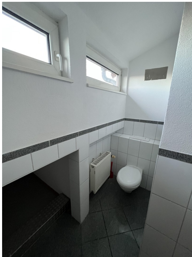
Gäste WC Oben