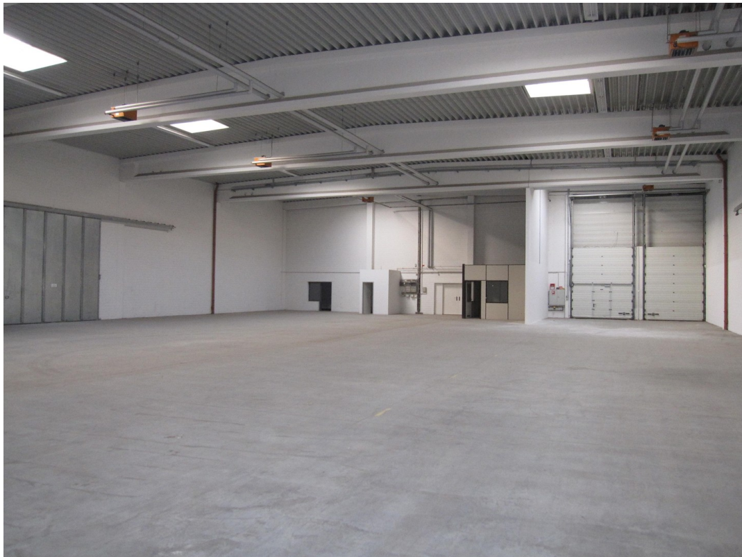
Hallenflächen (Zustand leer)