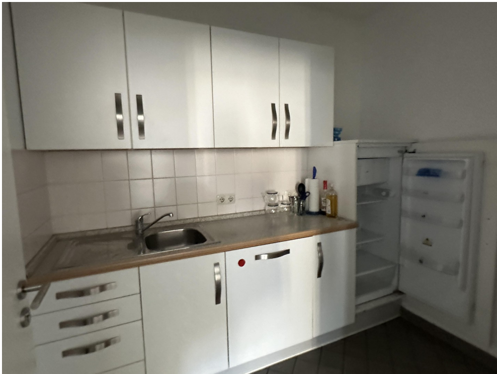
Teeküche mit Einbauküche