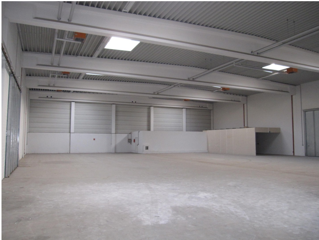
Hallenflächen (Zustand leer)