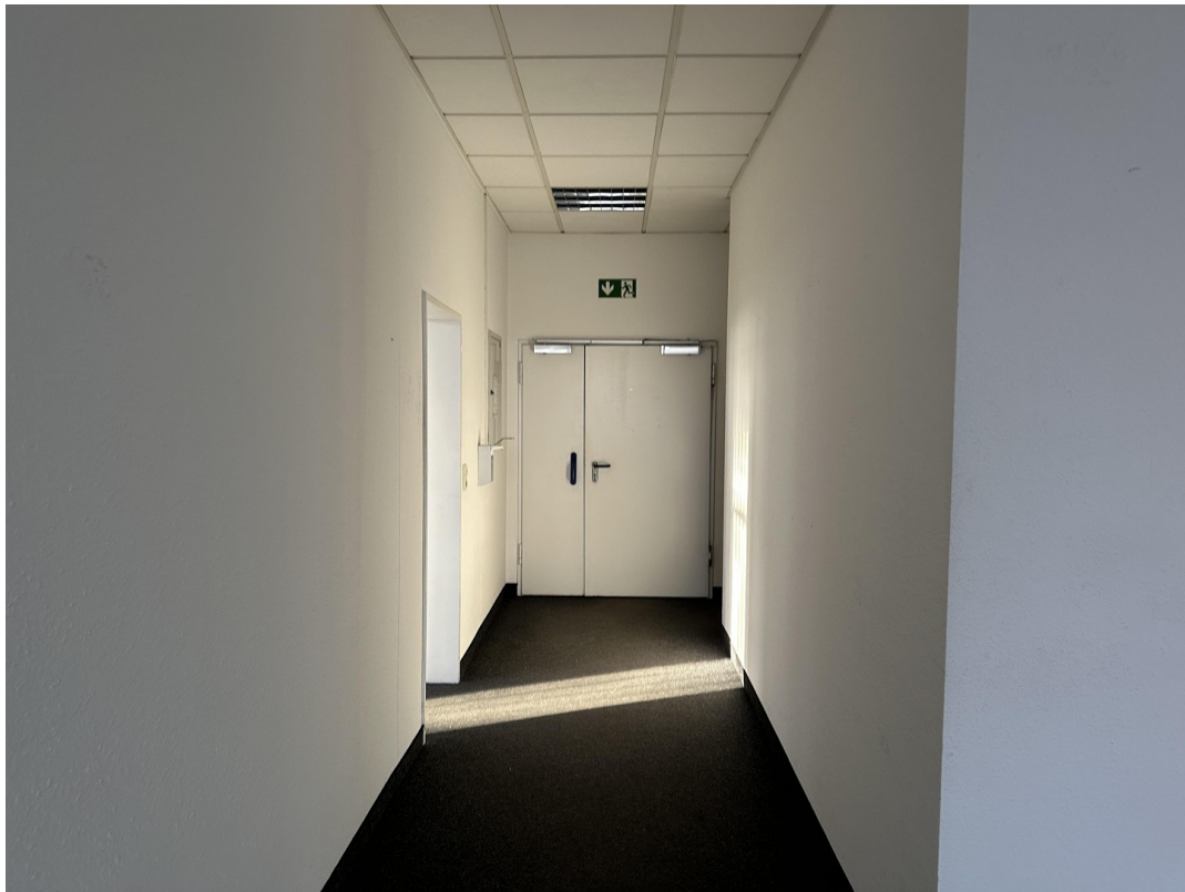
Zugang im Büro zur Halle