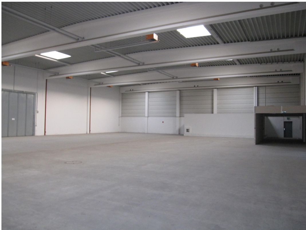
Hallenflächen (Zustand leer)