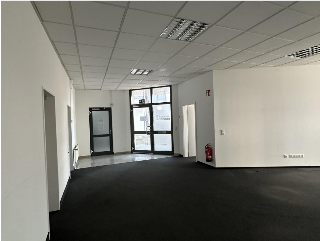
Empfang und Großraum