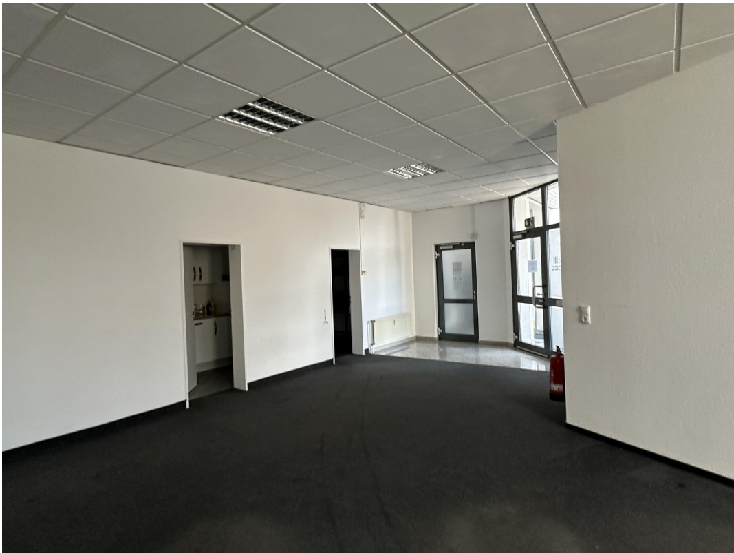
Empfang und Großraum