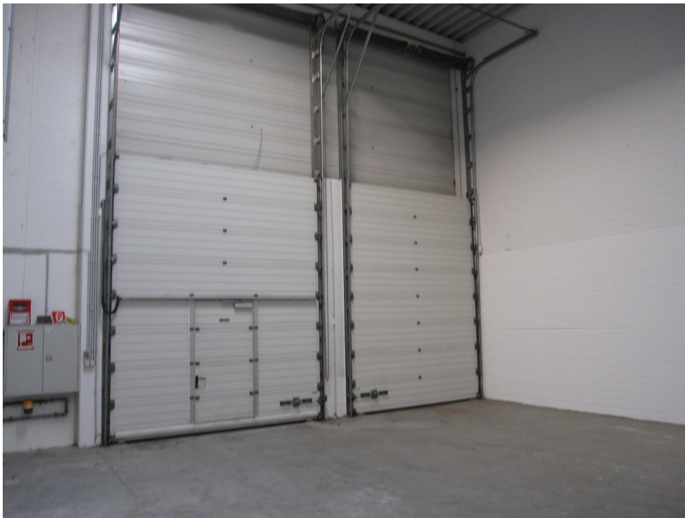
Hallentore ebenerdig und Rampe