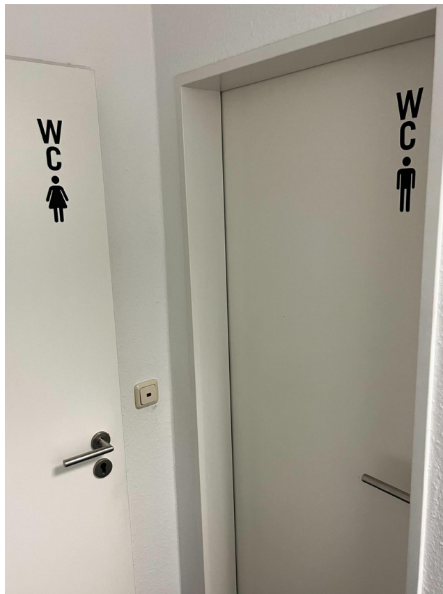
WC-Anlage Damen und Herren