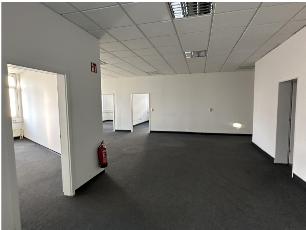
Empfang und Großraum