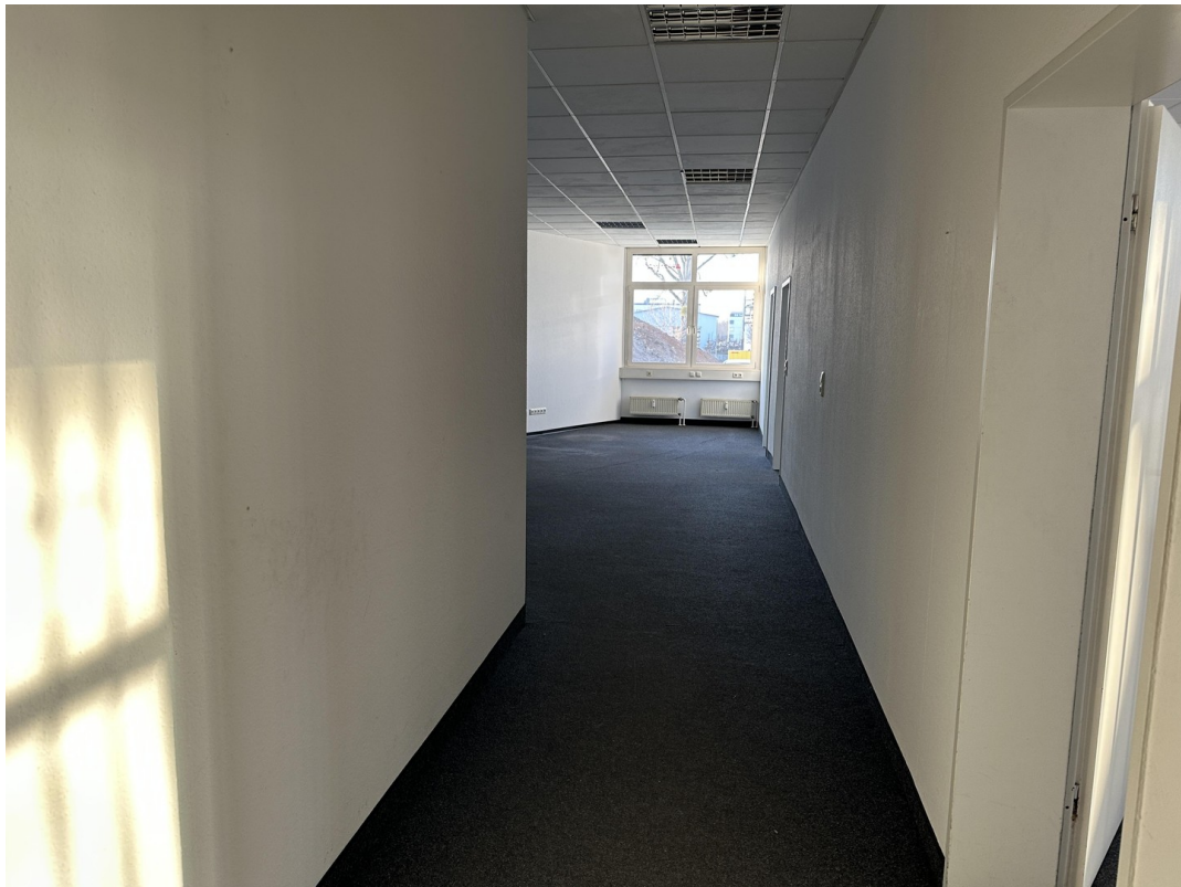
Flurbereich zur Hallenfläche