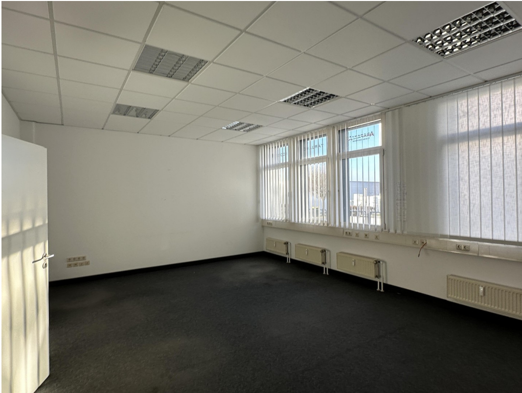
Bürraum 3 / Mehrfachplätze