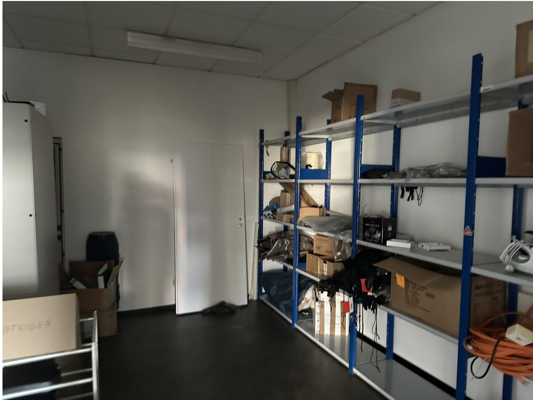
Archiv- und Serverraum