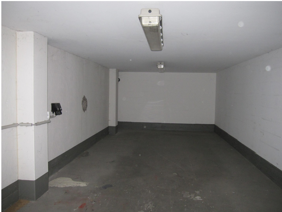
Abgetrennter Bereich in Halle