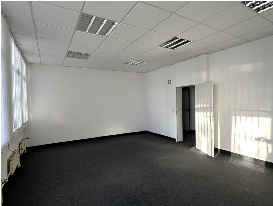
Bürraum 3 / Mehrfachplätze