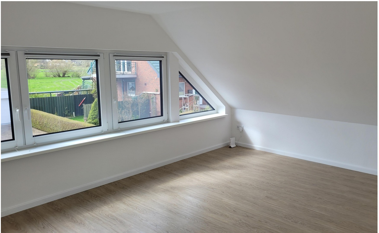
Wohnzimmer West 3