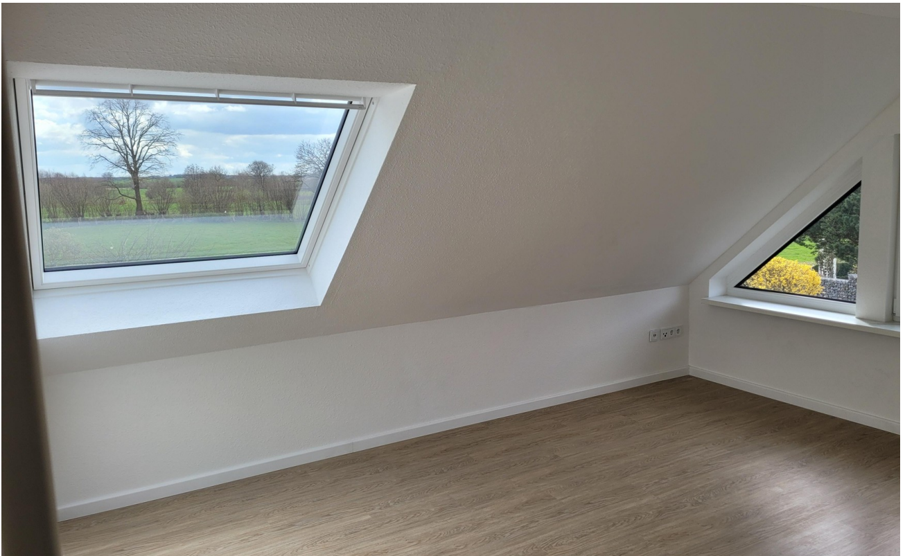
Wohnzimmer West 2