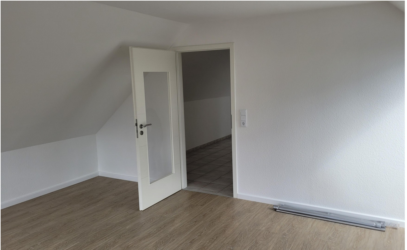
Wohnzimmer West 1