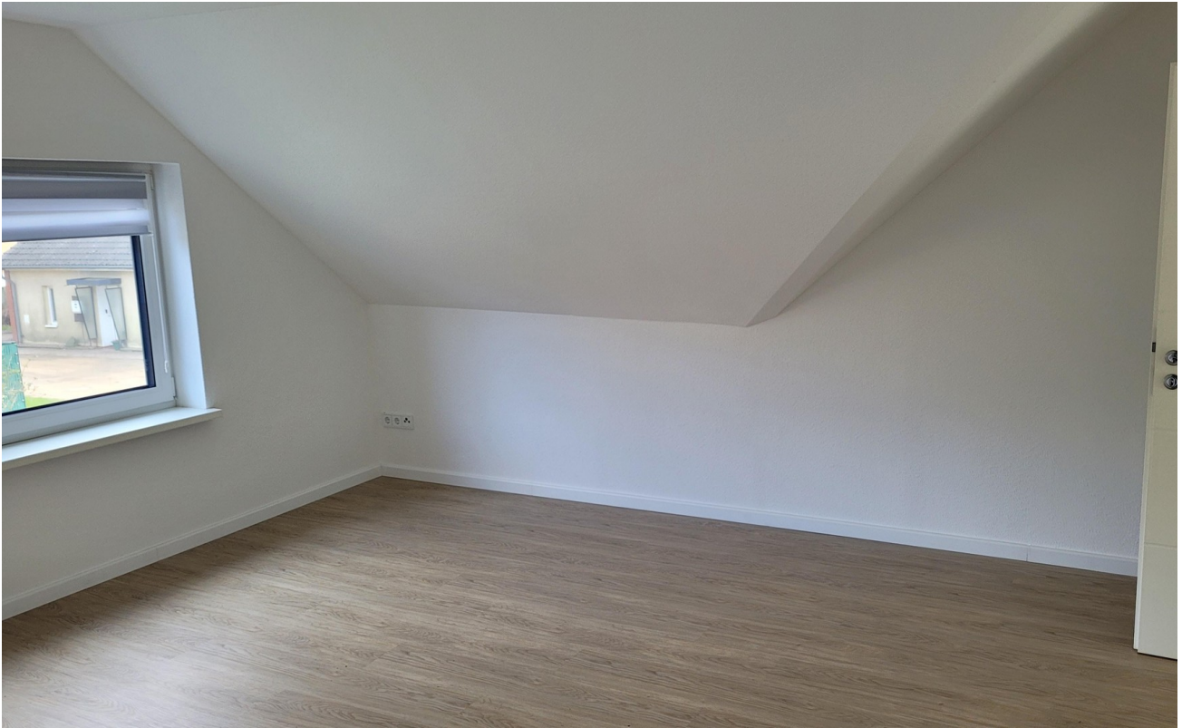
Schlafzimmer Ost 2