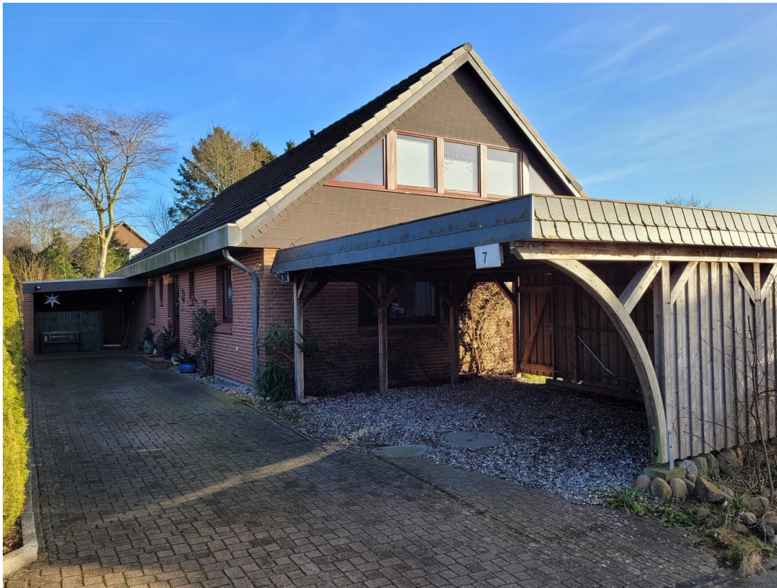
Frontansicht mit Doppelcarport