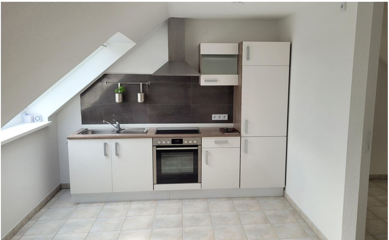
Küche mit EBK