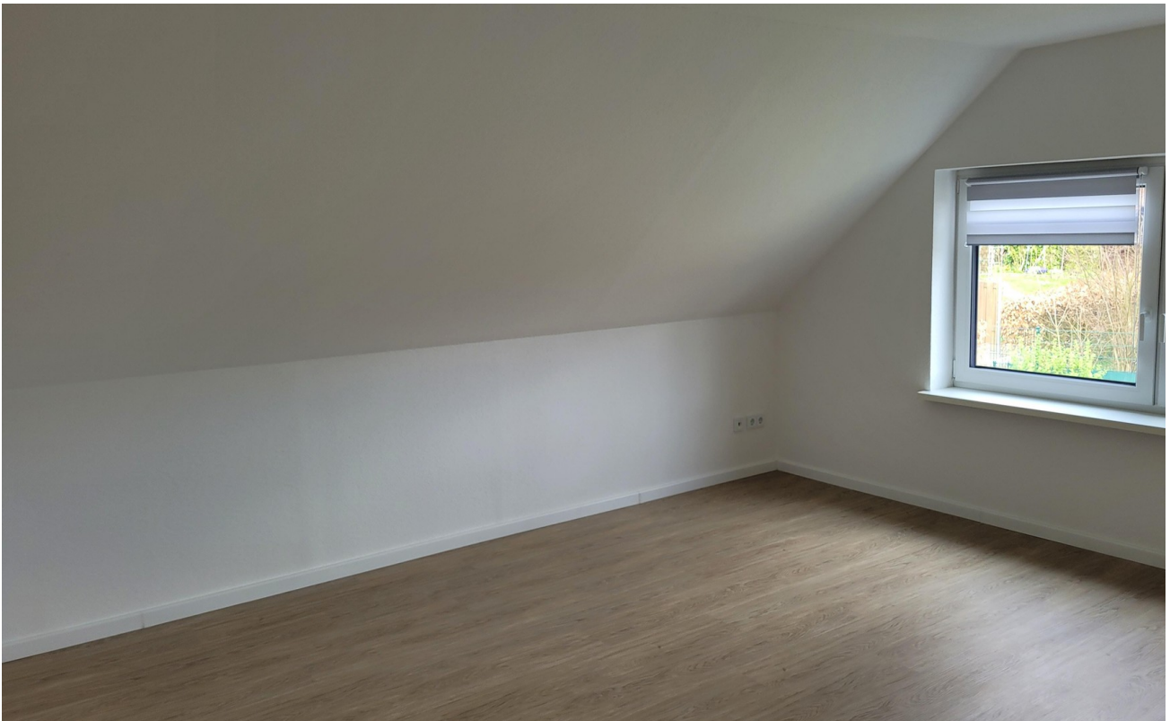
Schlafzimmer Ost 1