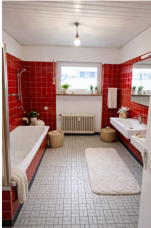
Badezimmer Badewanne + Dusche