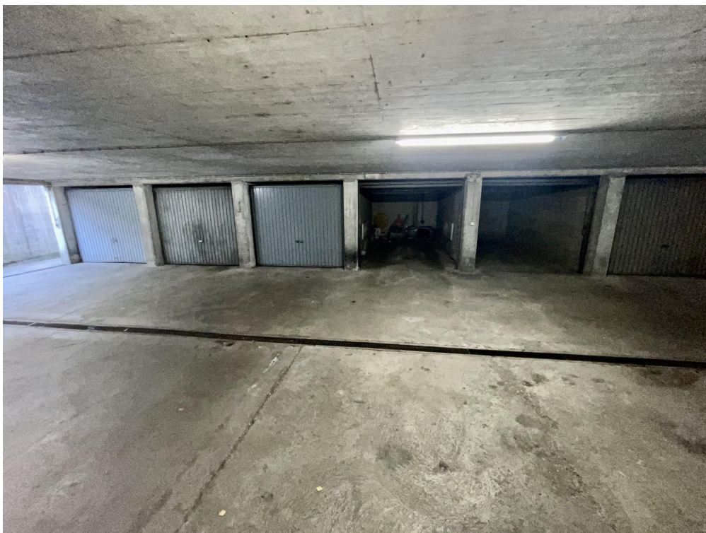
Garagenzufahrt 5. von links