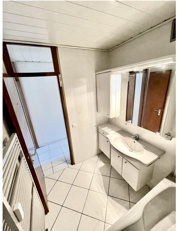
Bad von innen