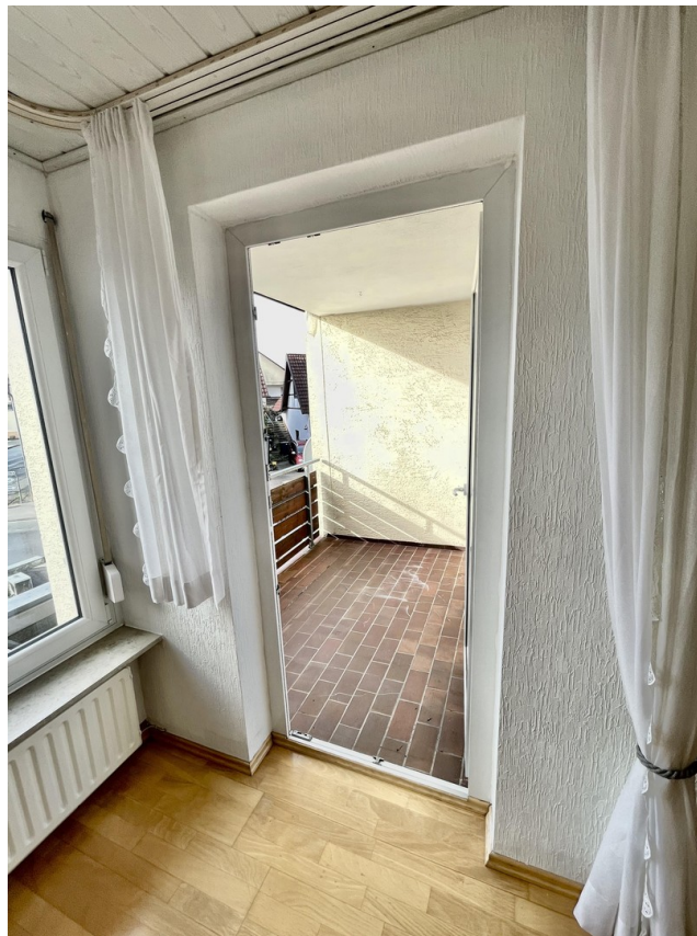
Zum Balkon Wohnzimmer