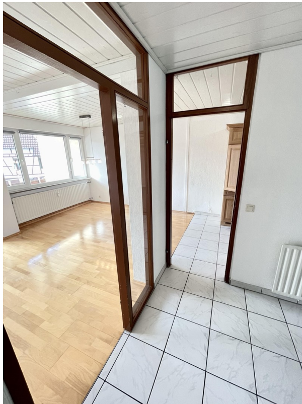
Von Flur zu Eingang Wohnen und