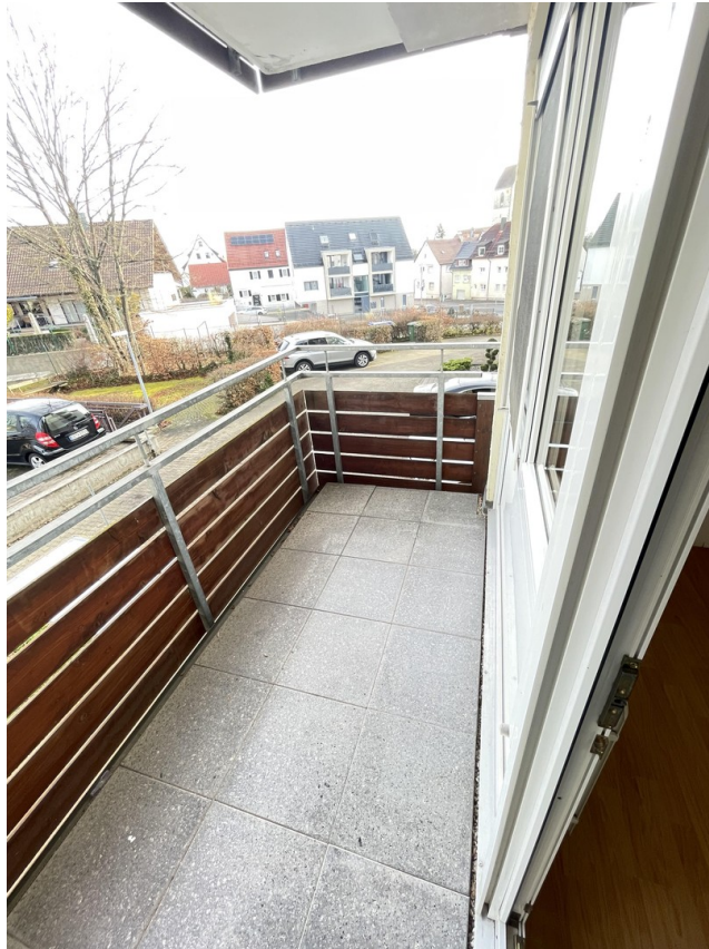
Balkon Ost Schlafzimmer 1