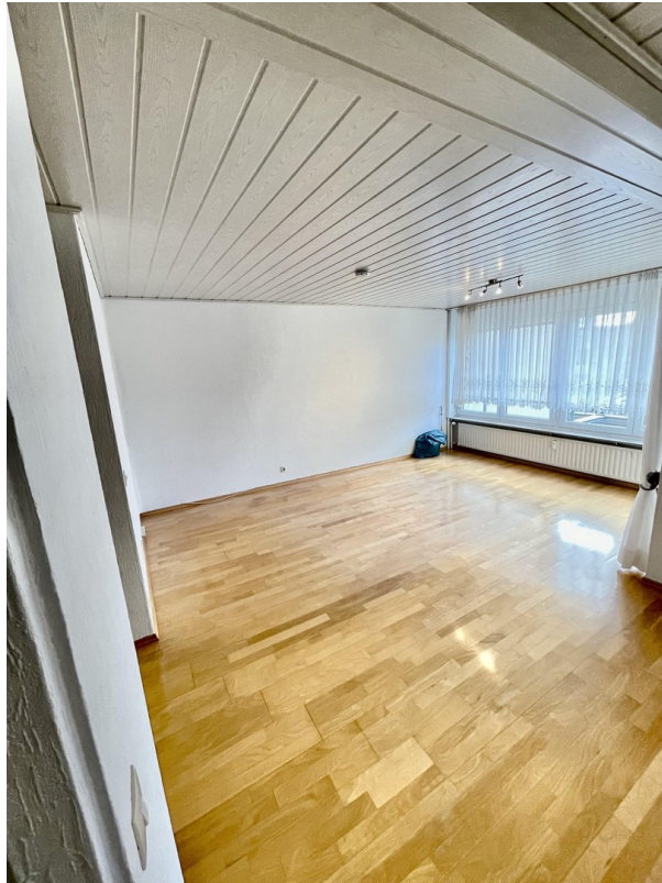
Wohnzimmer von Küche aus