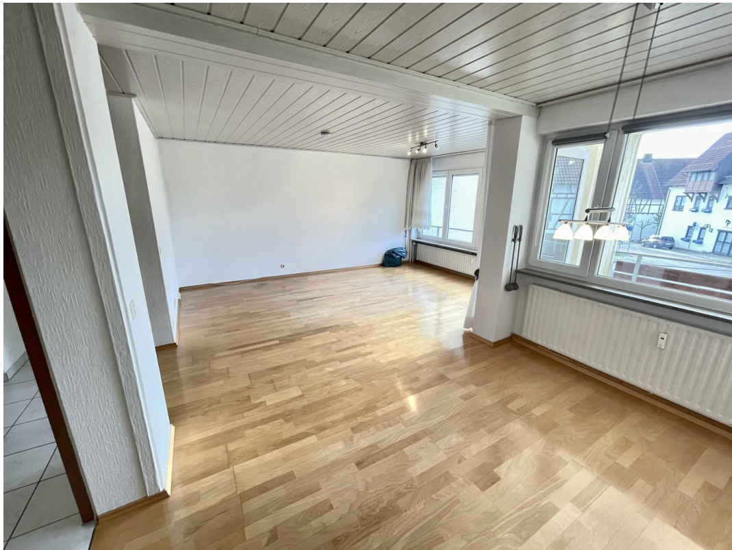
Von Küche/Essen zum Wohnzimmer