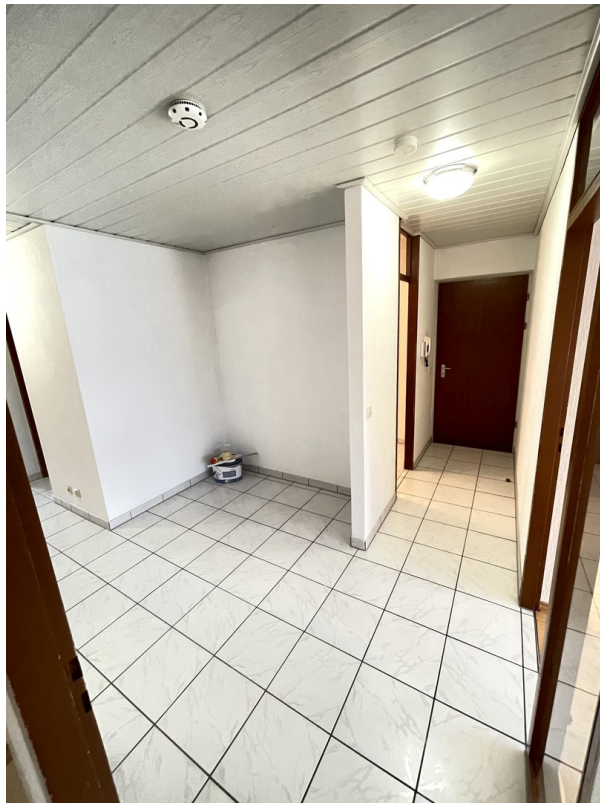
Diele, Flur, Abstellraum