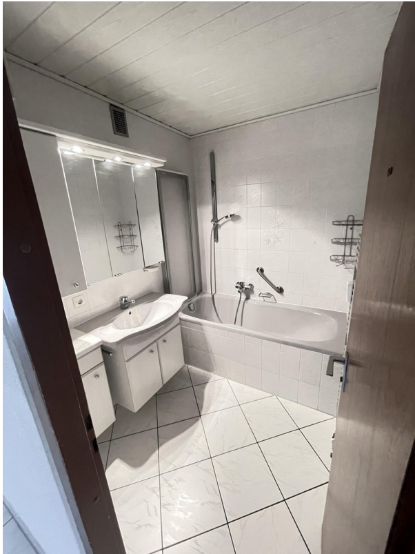
Bad von außen