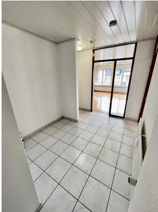
Diele Richtung Wohnzimmer