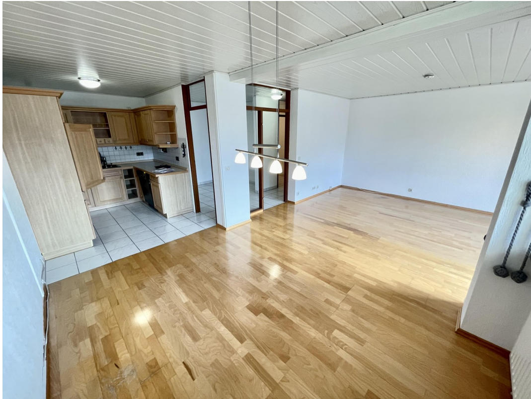
Esszimmer, Küche, Wohnzimmer