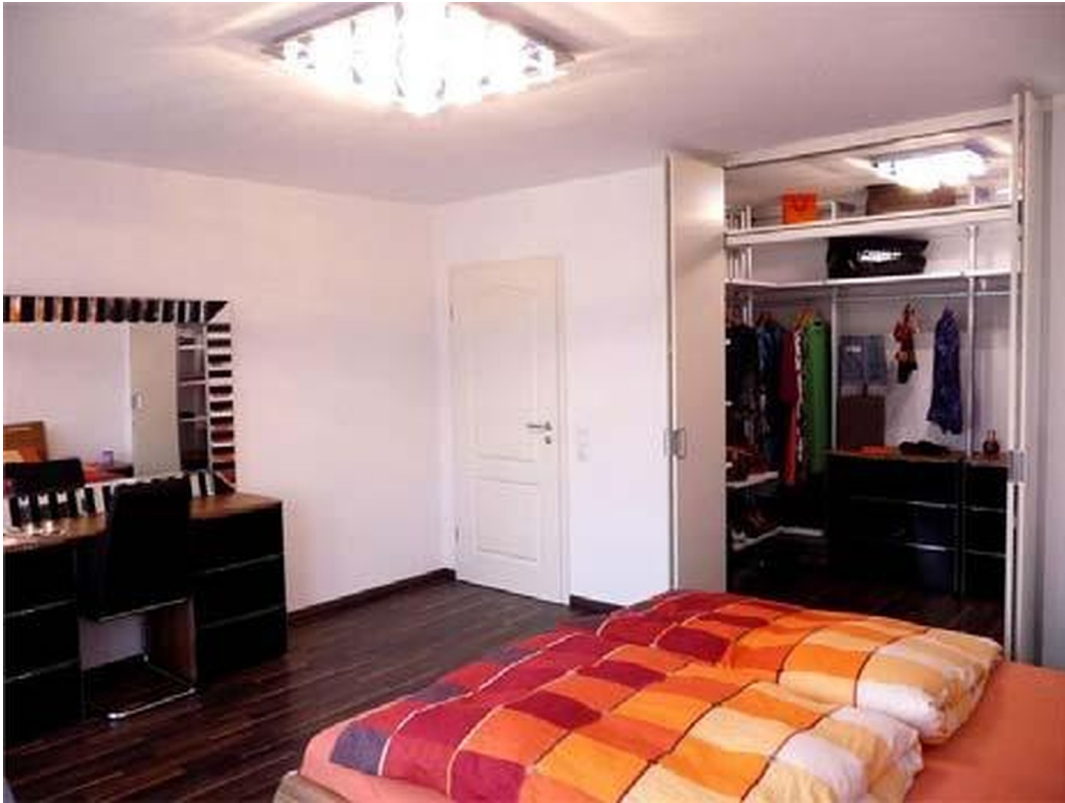
Schlafzimmer m. begeh. Schrank