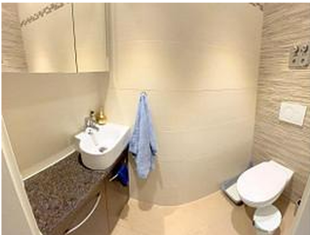
WC für Gäste