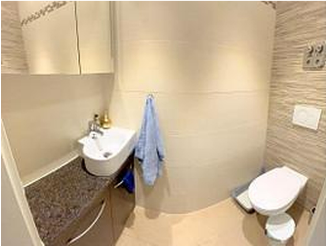
WC für Gäste