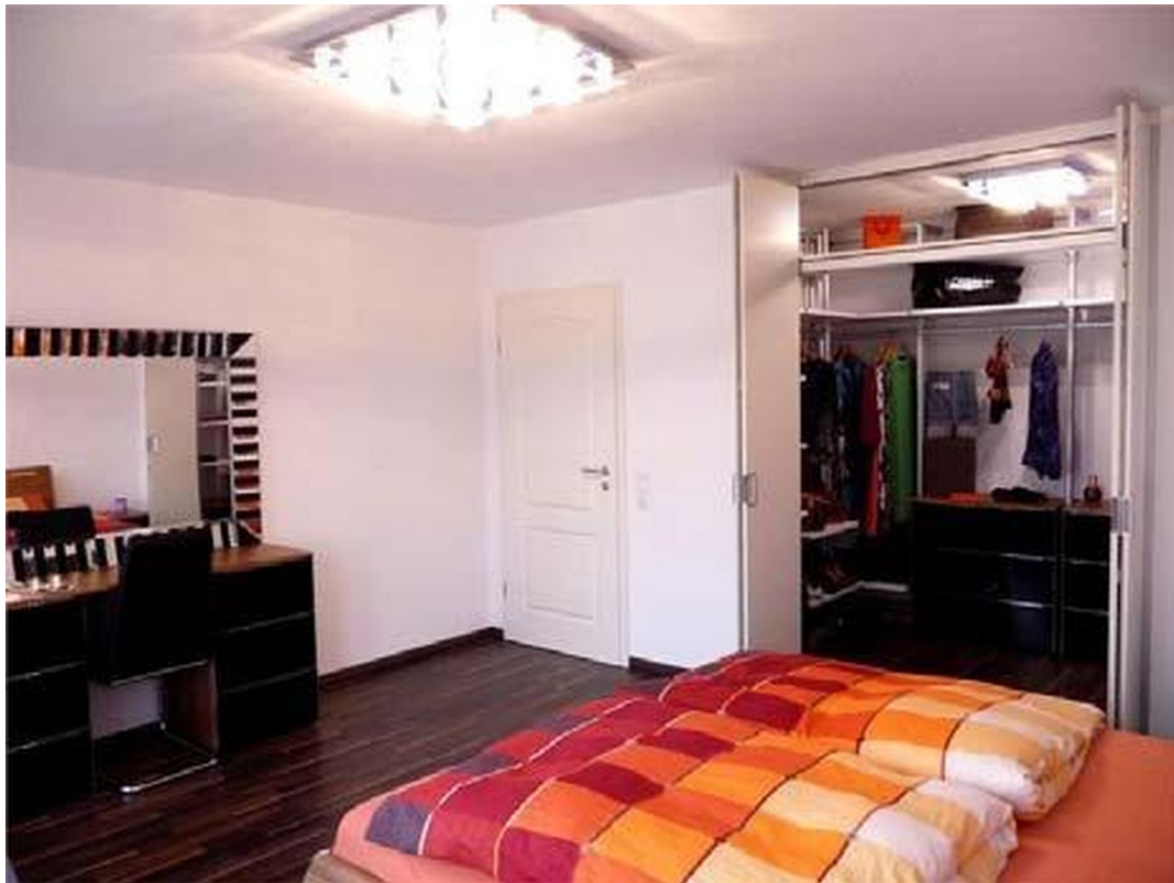
Schlafzimmer m. begeh. Schrank