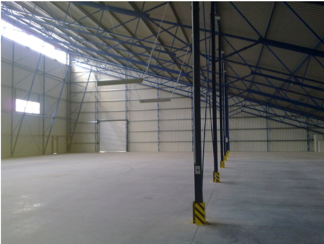
Schnitt 2 Halle