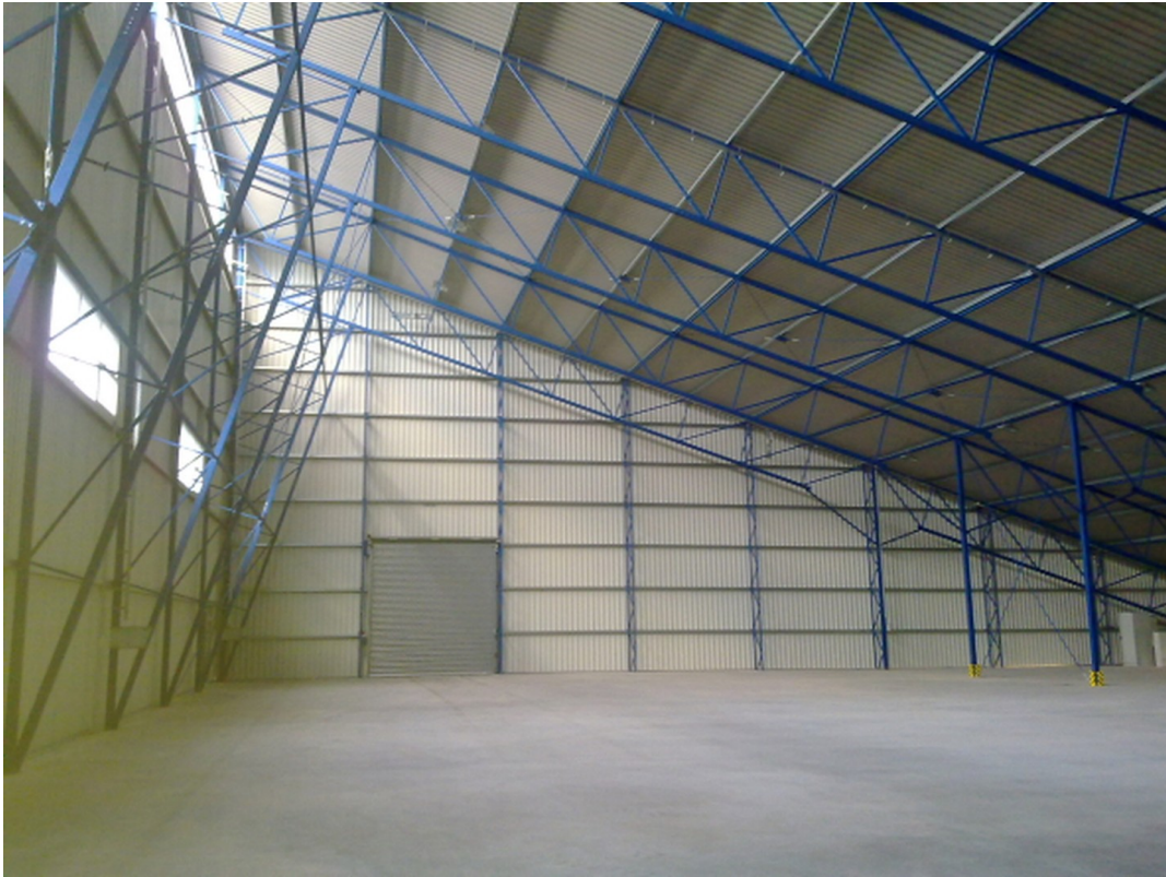
Schnitt 1 Halle