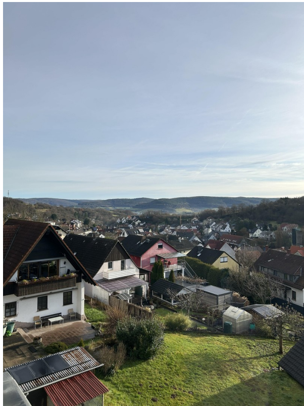
Blick in den Spessart