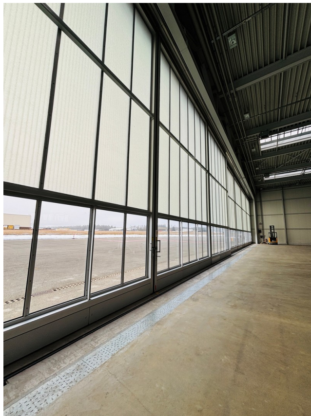
Schiebetoranlage 11 Meter Höhe