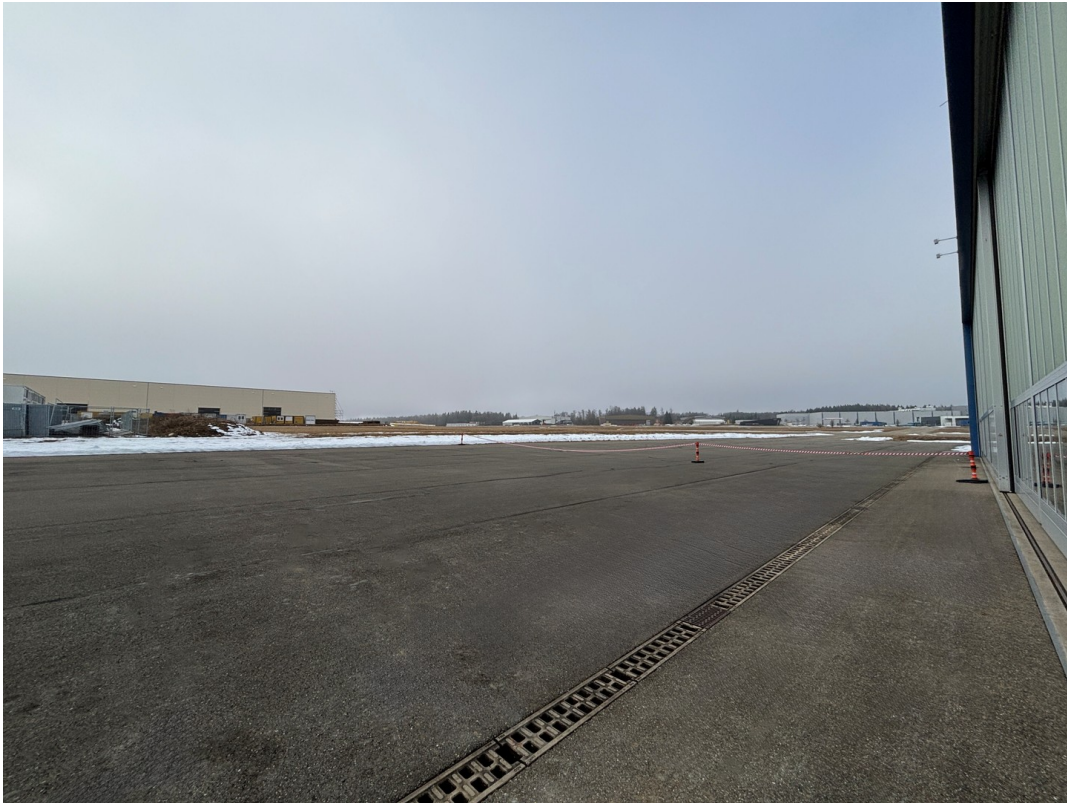
Außenrollfeld zum Taxiway