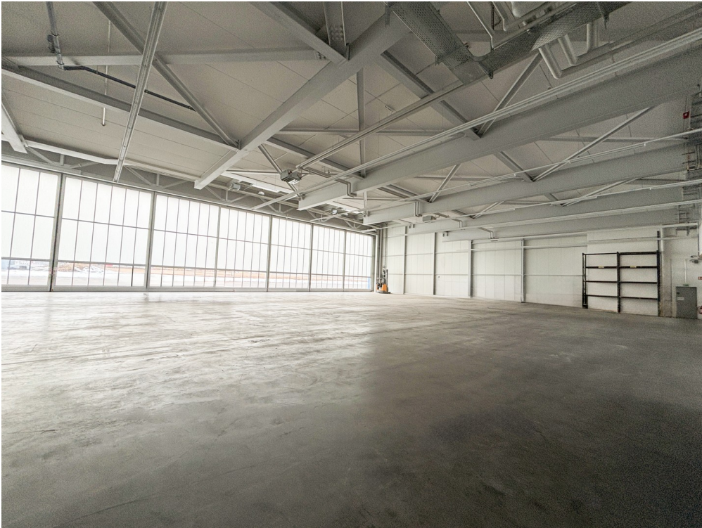
Hangar leeres Bild 2