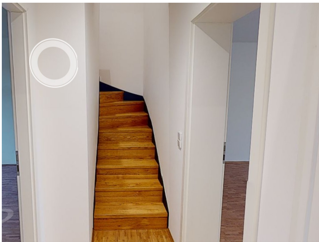
Treppenhaus - Maisonette