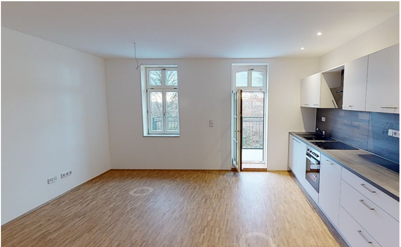
Küche mit Balkon