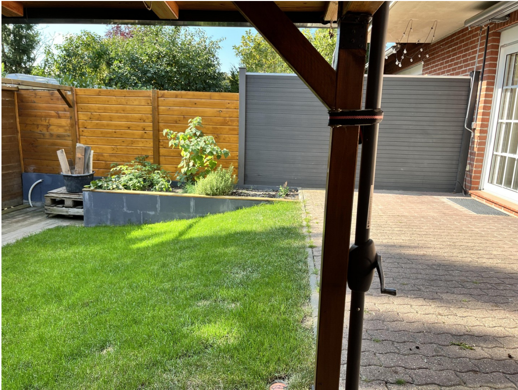
Garten / Terrasse