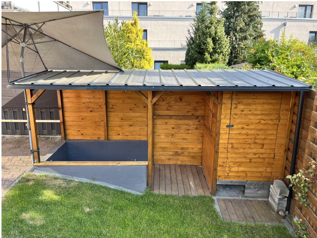
Unterstand und Schuppen