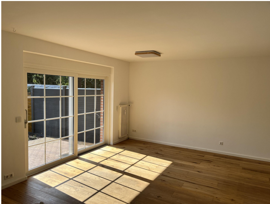
Wohnbereich / Terrasse