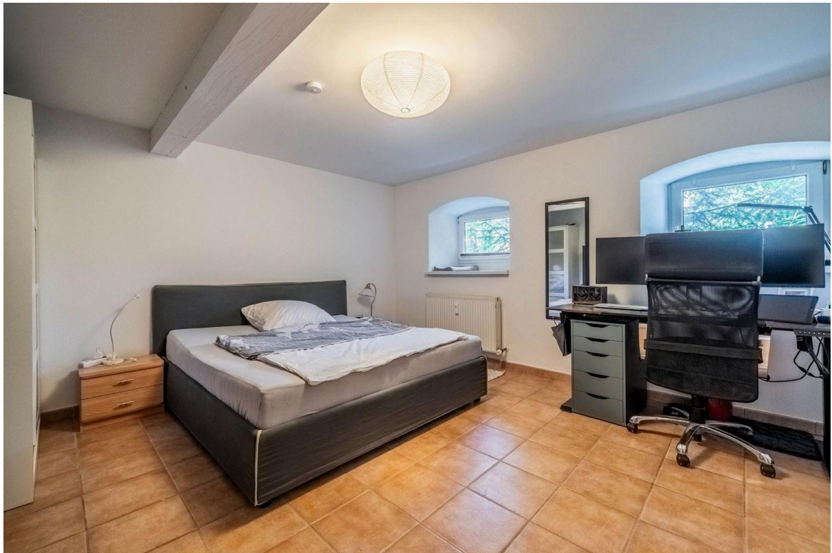
Gästezimmer / Büro