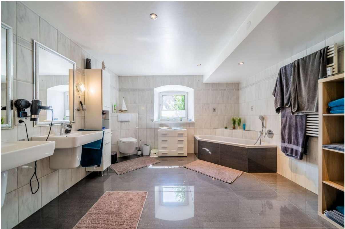
17 qm Bad