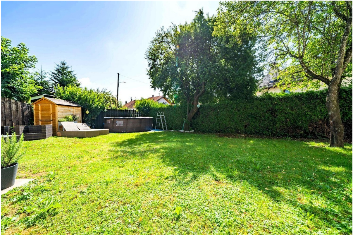
280 qm Garten