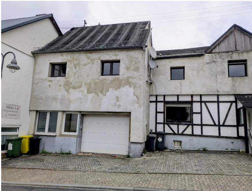
Bild 5: Anwesen, Rheinstraße 8a Fl. St. 4770/5, Nebengebäude (Oktober 2025)