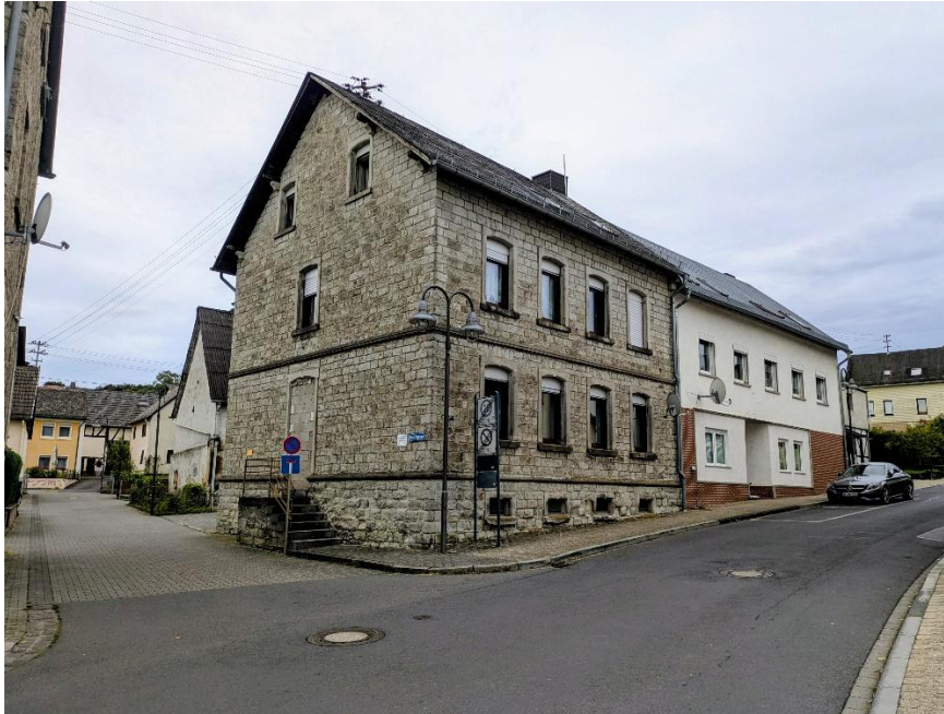
Bild 1: Städtebauliche Situation im Einmündungsbereich „Bleichgasse / Rheinstraße“ (Oktober 2025)