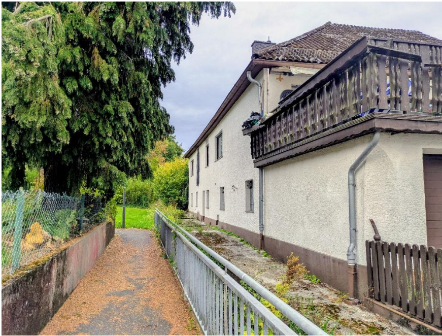
Bild 3: Anwesen, Bleichgasse 6 Fl. St. 4771/2 mit Fußweg zur Waldstraße / Krankenhaus (Oktober 2025)