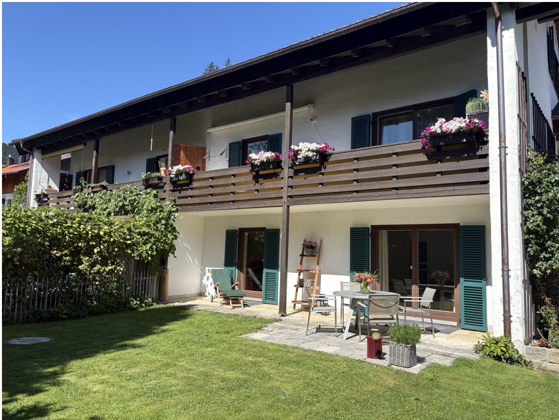
Terrassenwohnung Bild 2