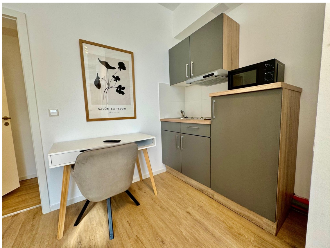
Küche und Schreibtisch