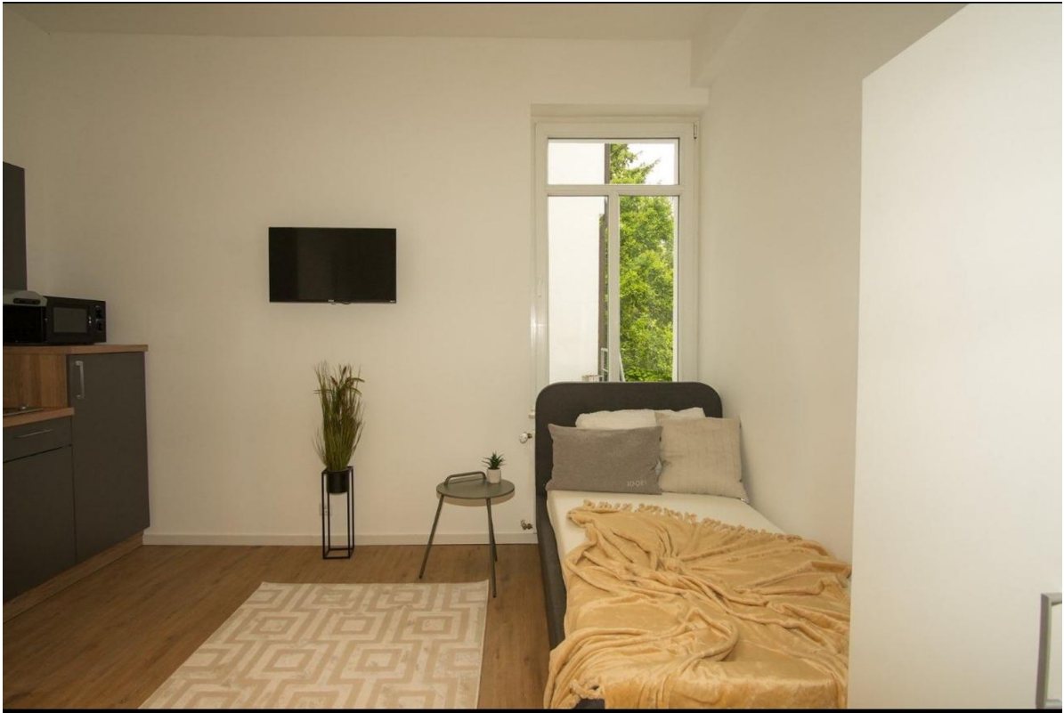
Apartment mit kleinen Bett