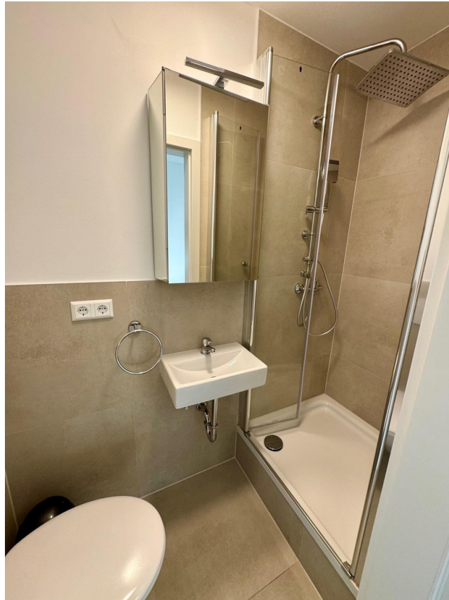
Bad / WC mit Dusche