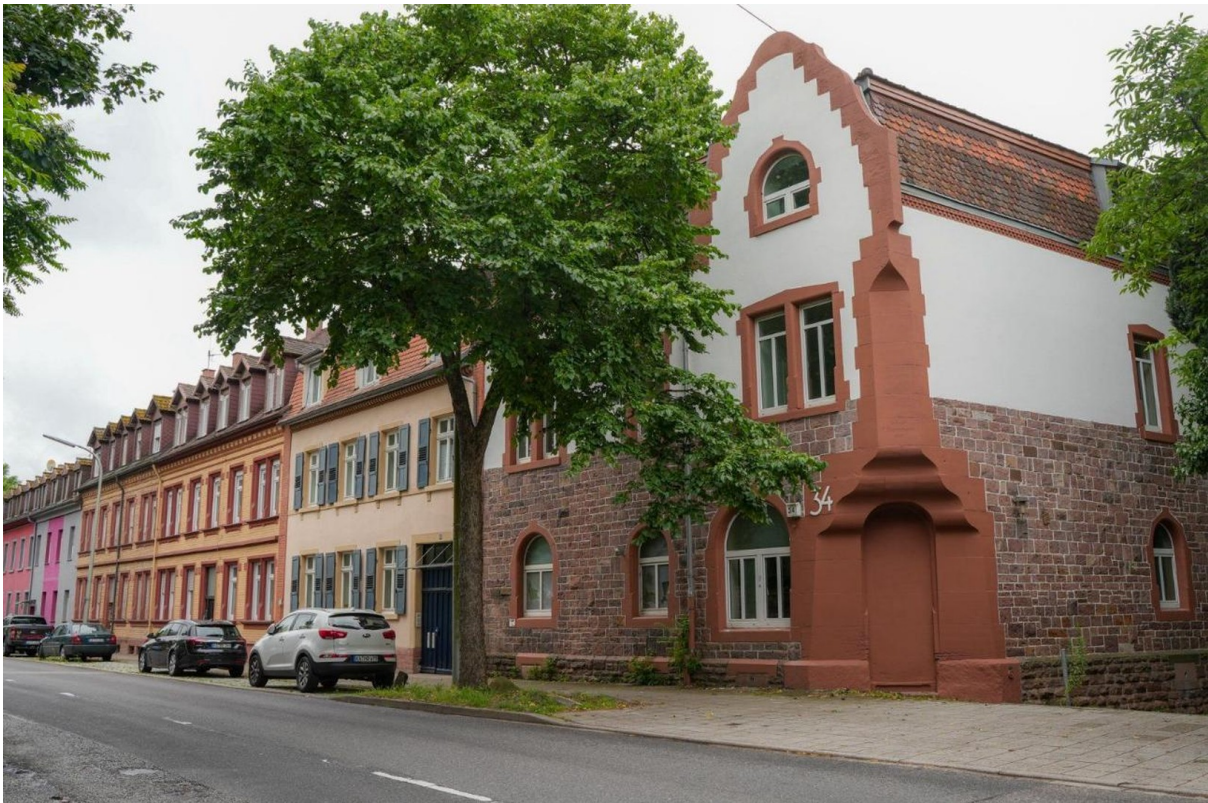
Haus von Außen