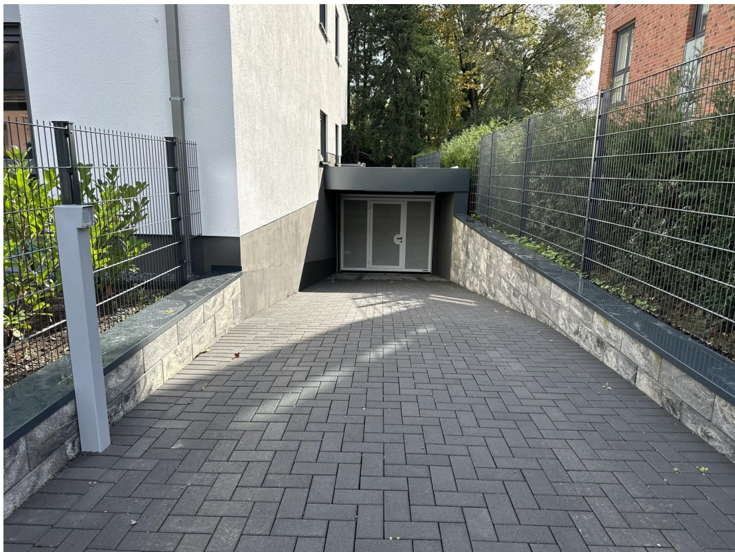
Zufahrt - TG