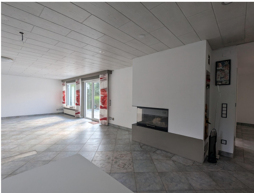
Wohn-/Esszimmer mit Kamin