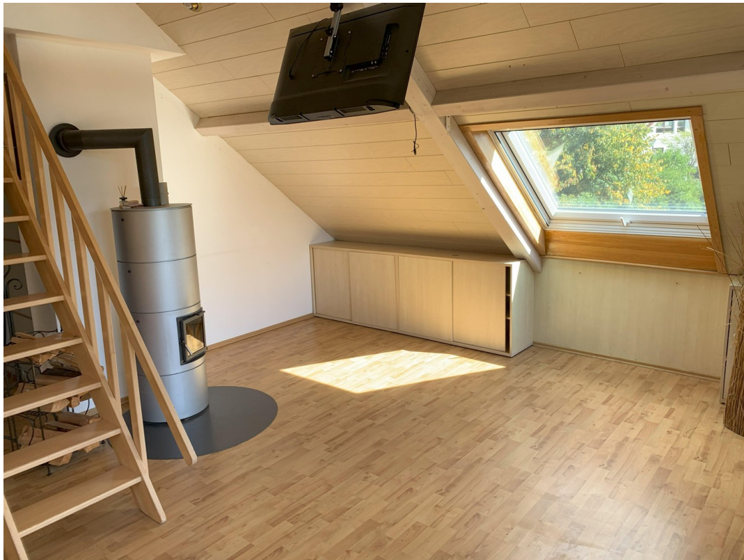
Studion mit Kamin(Rondolino)