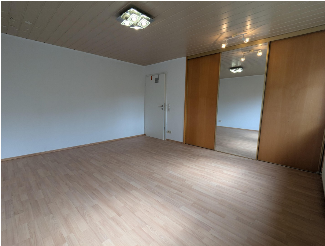
Zimmer 1 / begehbarer Schrank