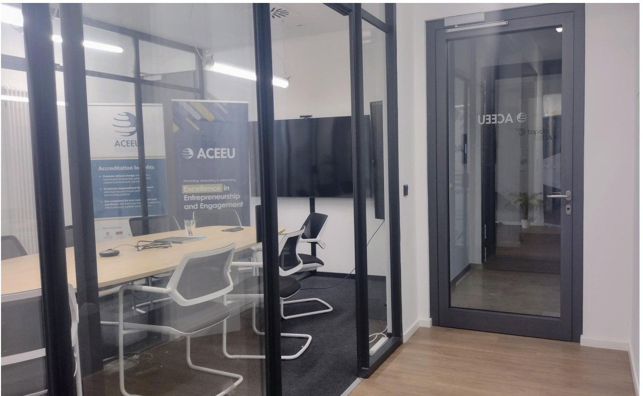
Eingang, Flur, Meetingraum