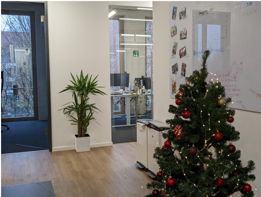
Flur an der Küche