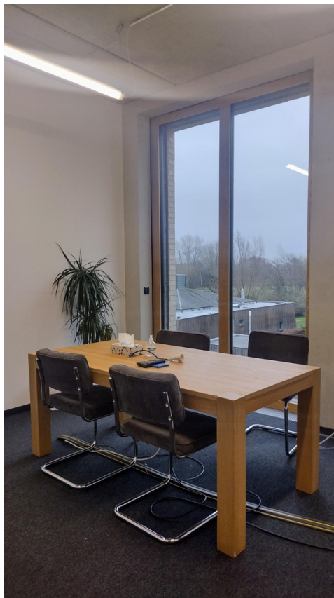
Hohe Fenster (Büroraum-Bsp)