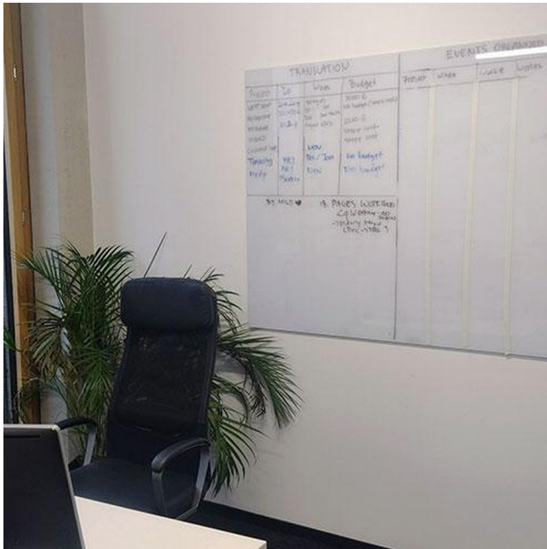
Whiteboard in jedem Raum