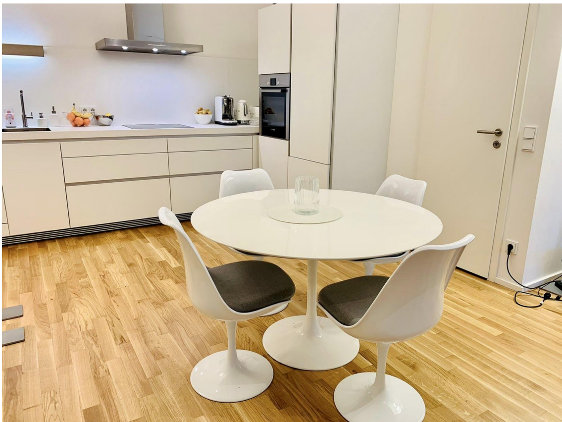
Küche mit Esszimmer