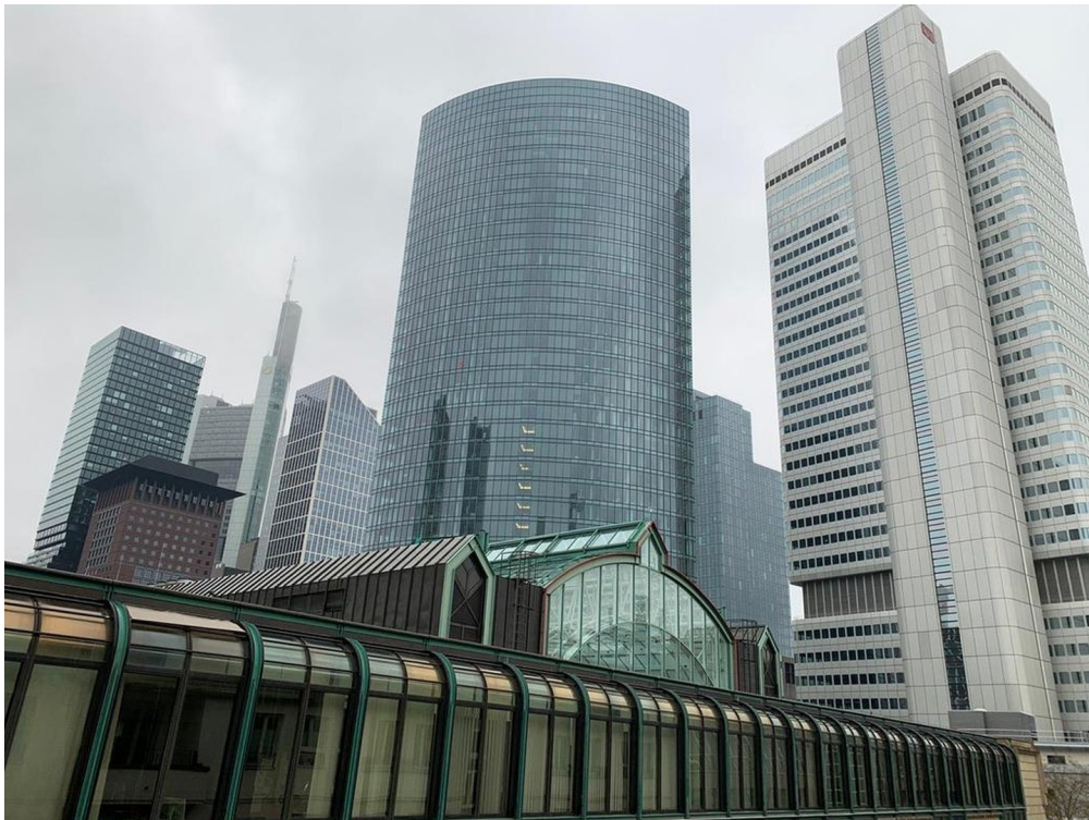
Blick aus dem Balkon