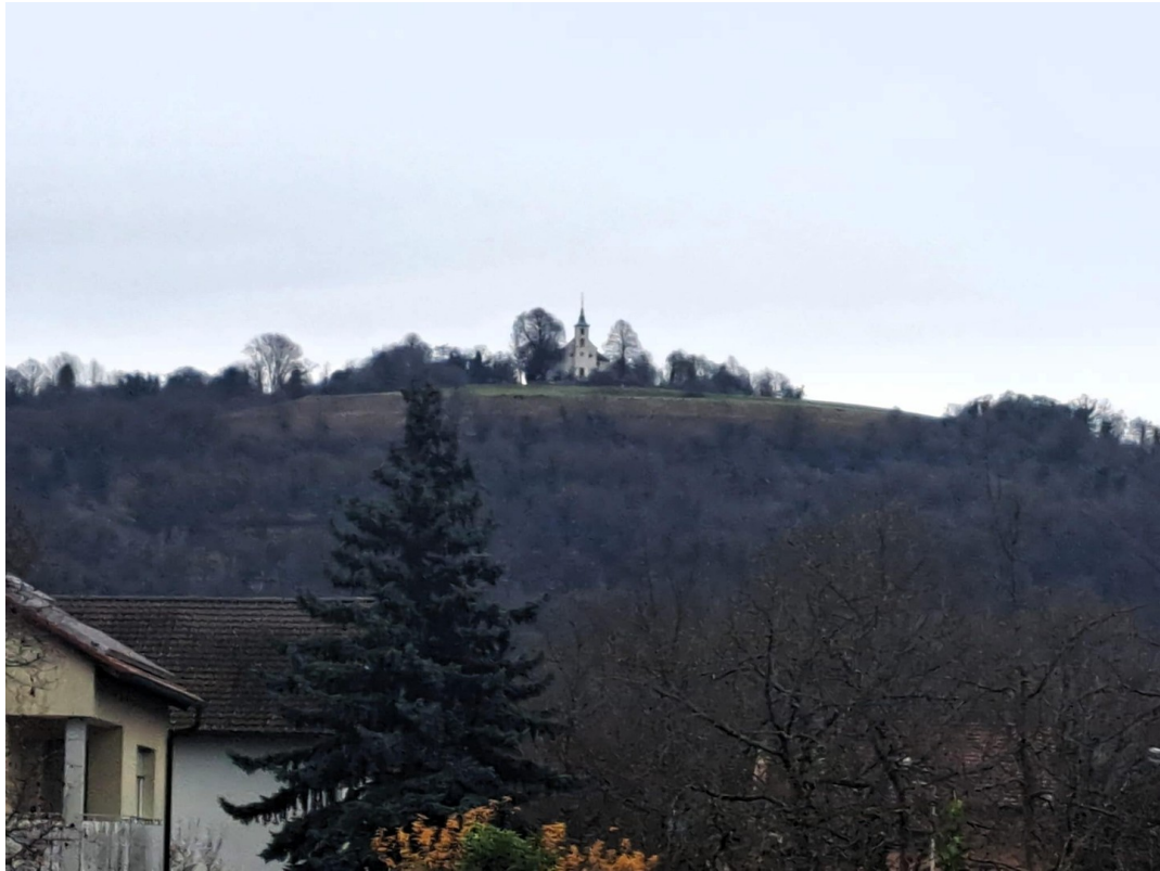
Blick aus dem Fenster