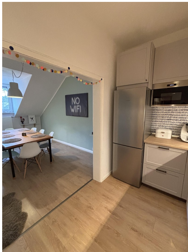
Küche / Esszimmer