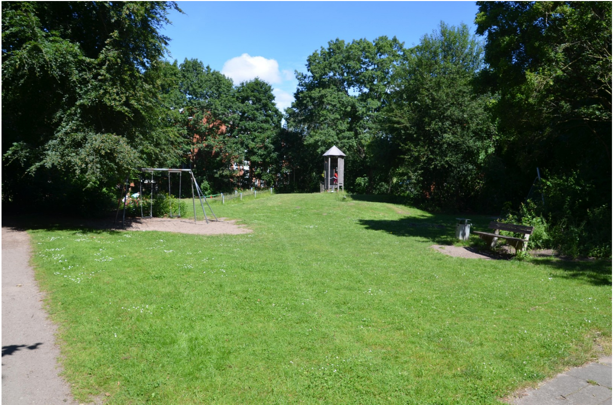
Park im Anschluss an das Haus