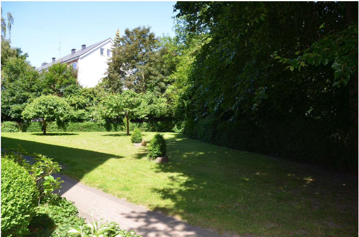
Grundstück an den Eingängen