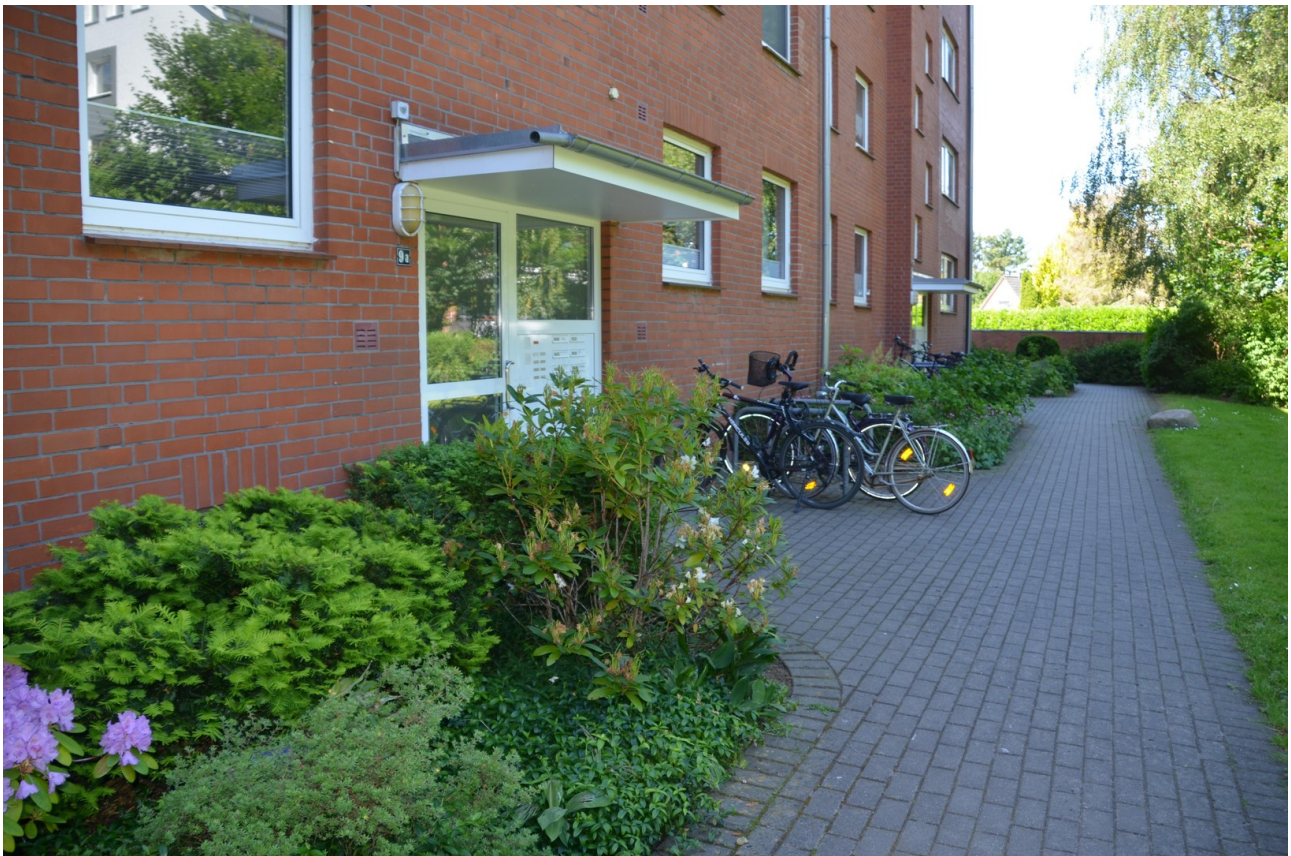
Eingang Julius-Brecht-Str. 9a