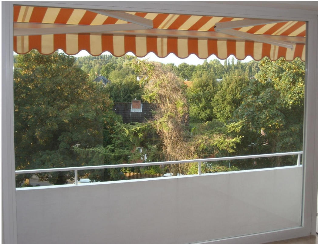
Balkon mit Markise