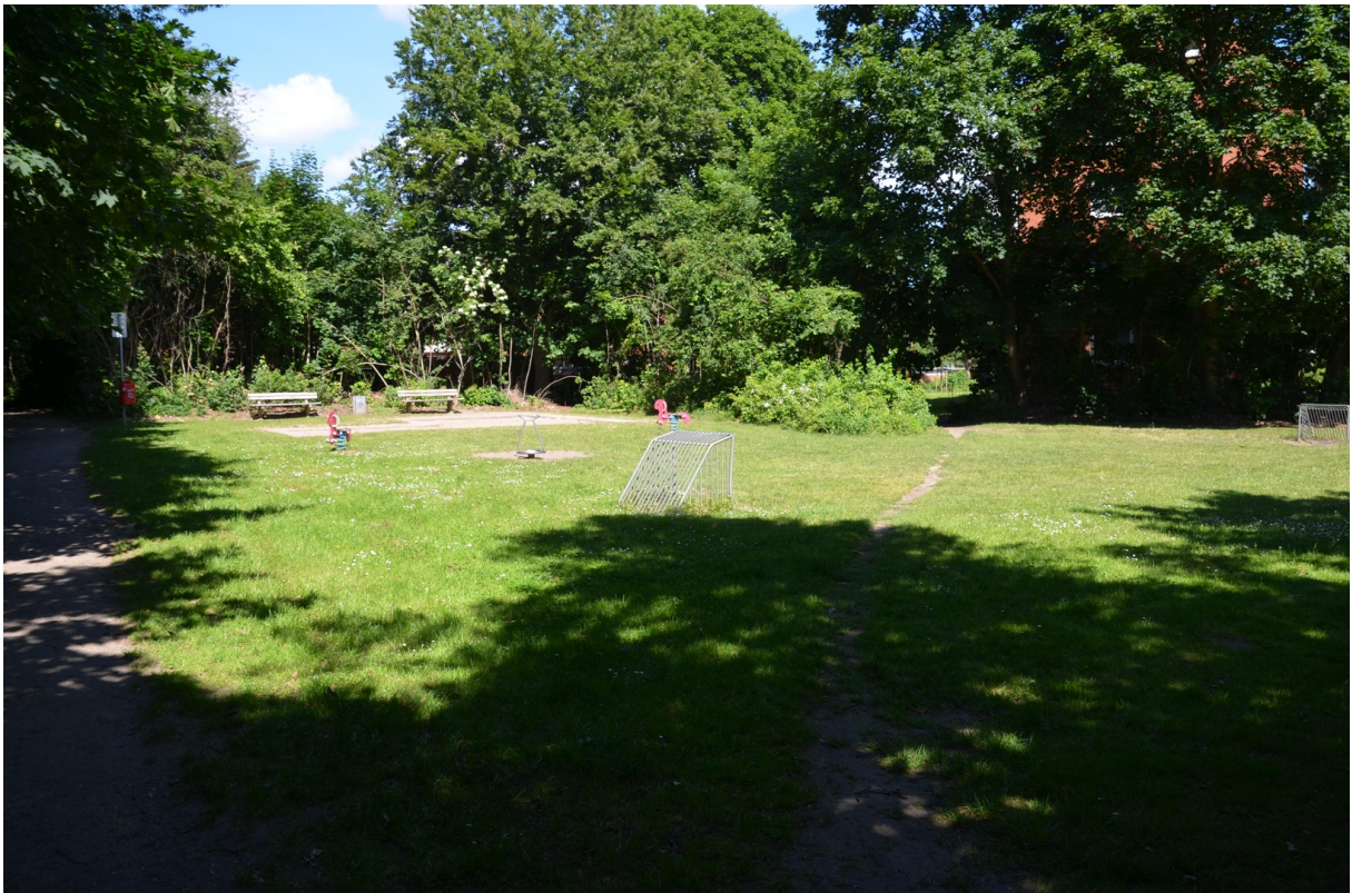
Park im Anschluss an das Haus