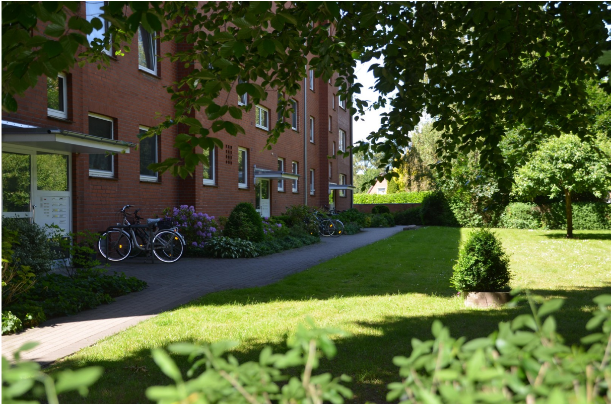
Grundstück vor dem Haus