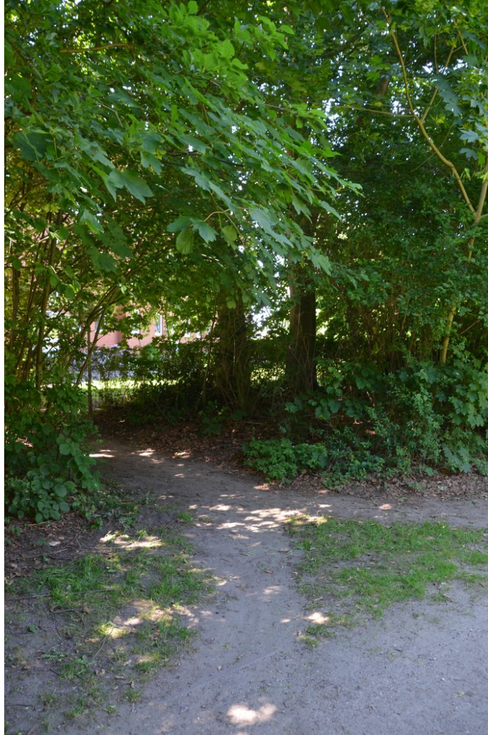
Durchgang zum Haus