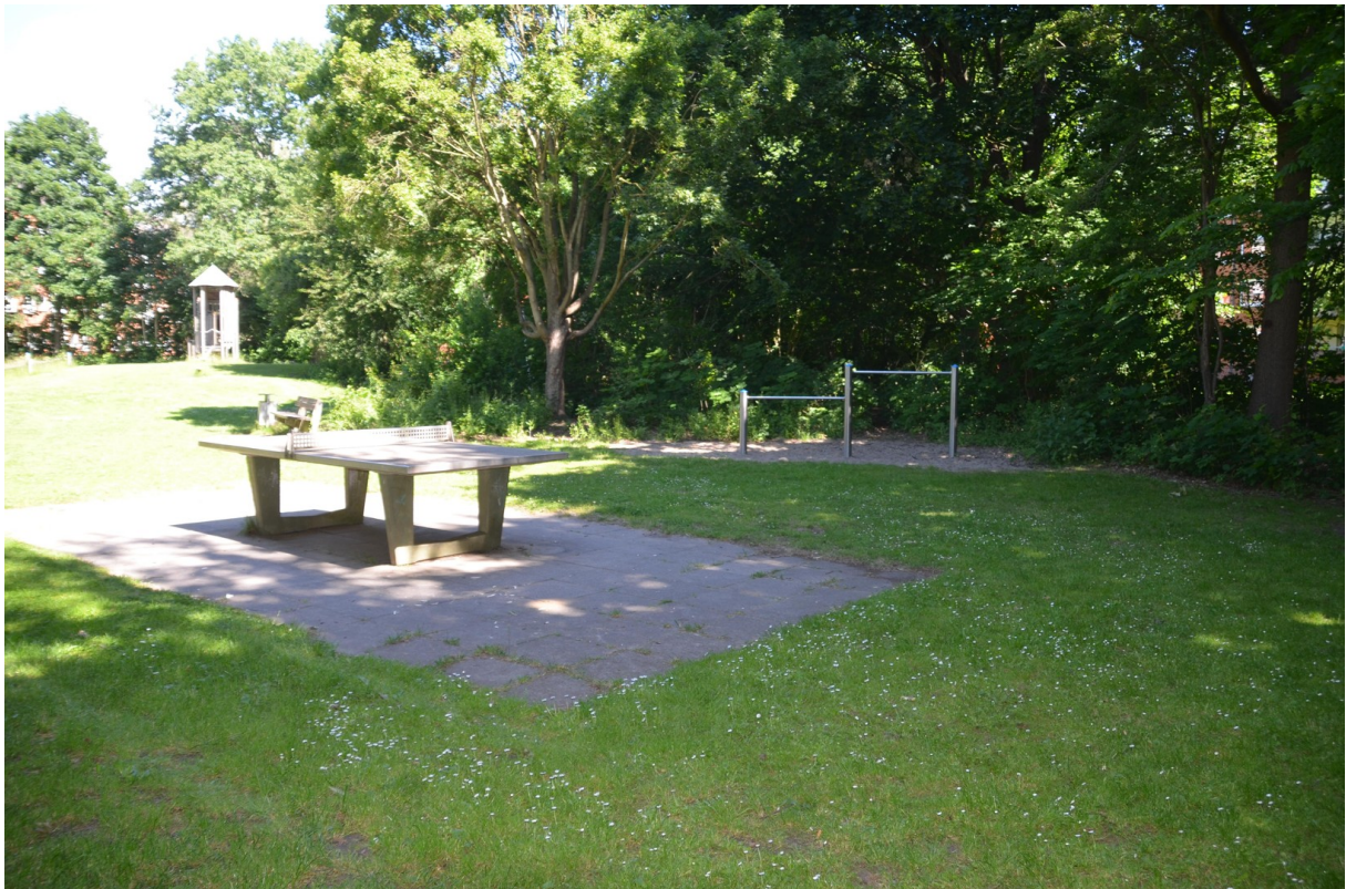
Freizeitmöglichkeit im Park