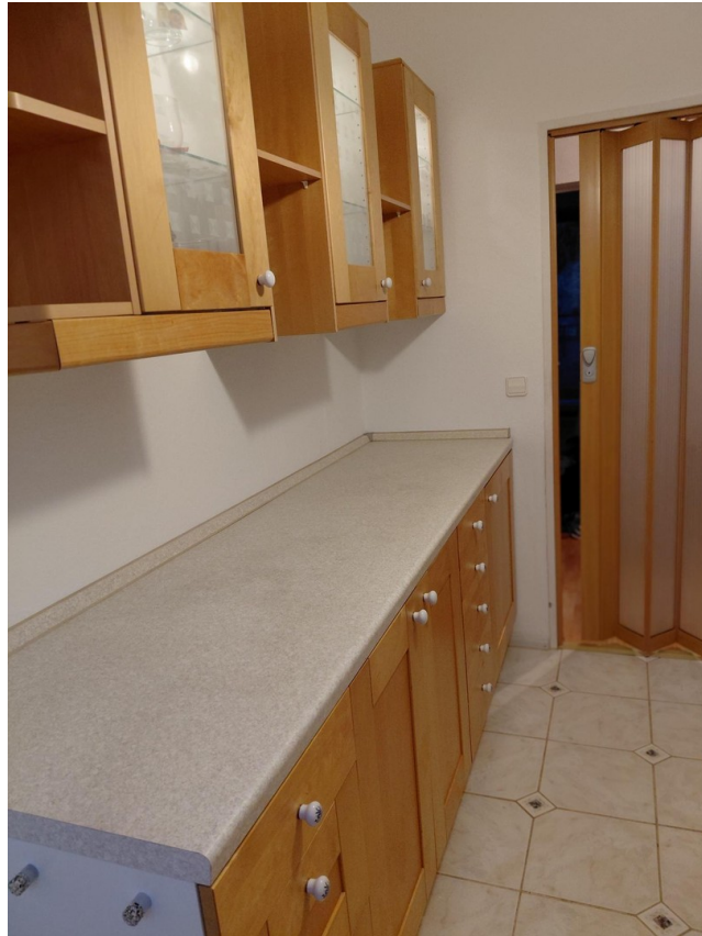
neuer Einbaukühlschrank (2025)