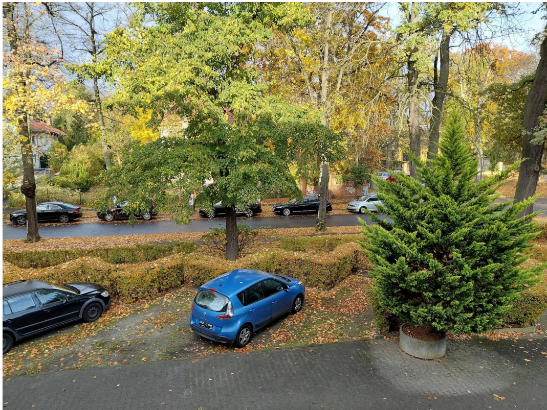
Blick nach vorne