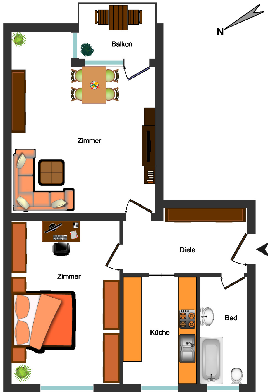
Grundriss 1. Obergeschoss