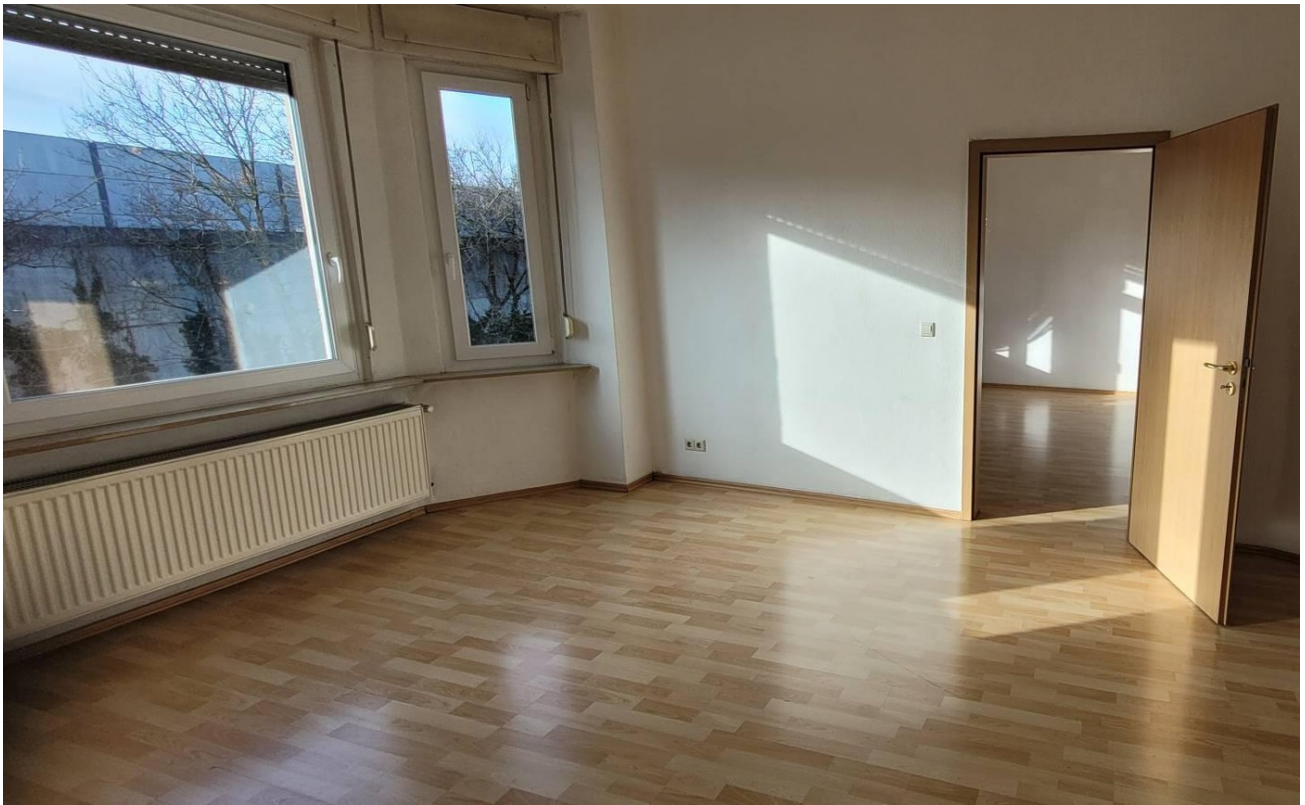
Wohnzimmer mit Erker