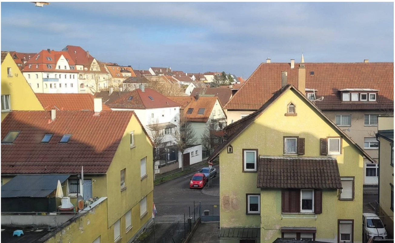
Ausblick vom Schlafzimmer