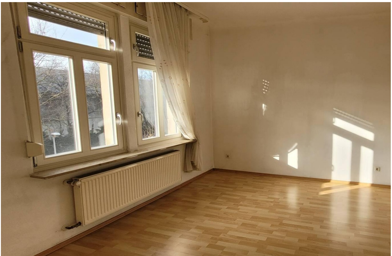
Kinder- bzw. Arbeitszimmer