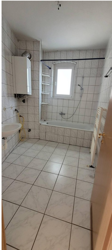
Tageslichtbad mit Badewanne