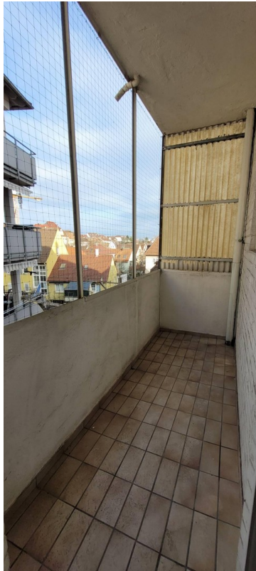
Balkon von der Küche gesehen