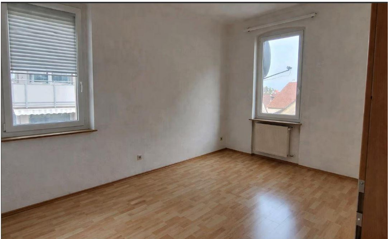
Schlaf- bzw. Kinderzimmer