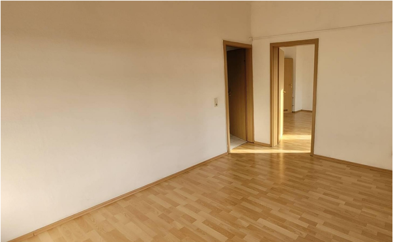
Kinderzimmer mit Übergang Flur