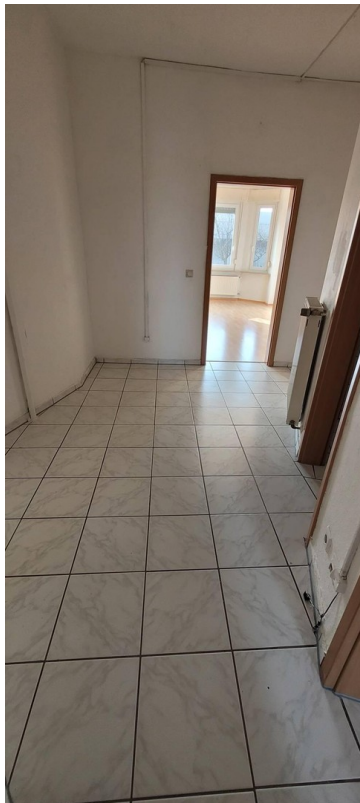
Flur hell gefliest