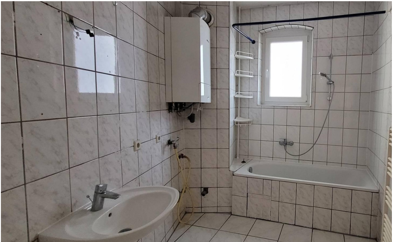
Tageslichtbad mit Badewanne