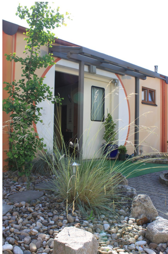
Eingang 2 Flachbau