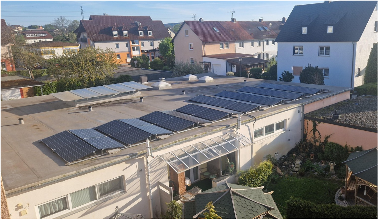
PV Anlage 15,4 kwp