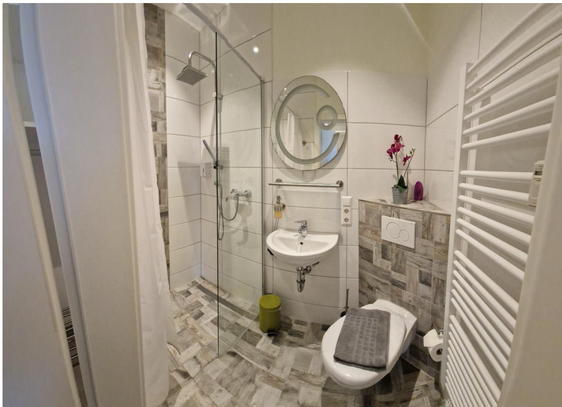
Beispiel Bad, kl. Apartment