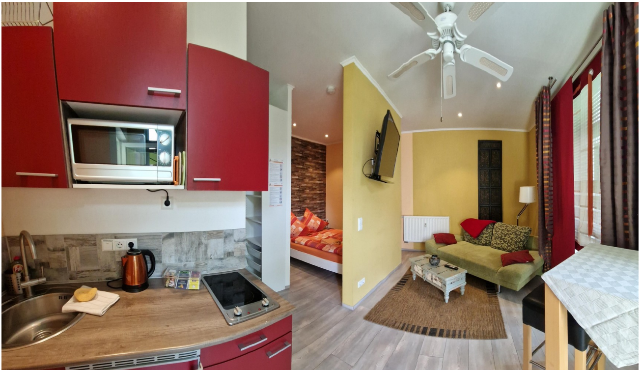
Beispiel kl. Apartment