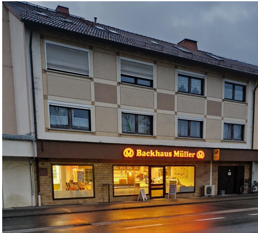
Wohnungen und Gewerbe