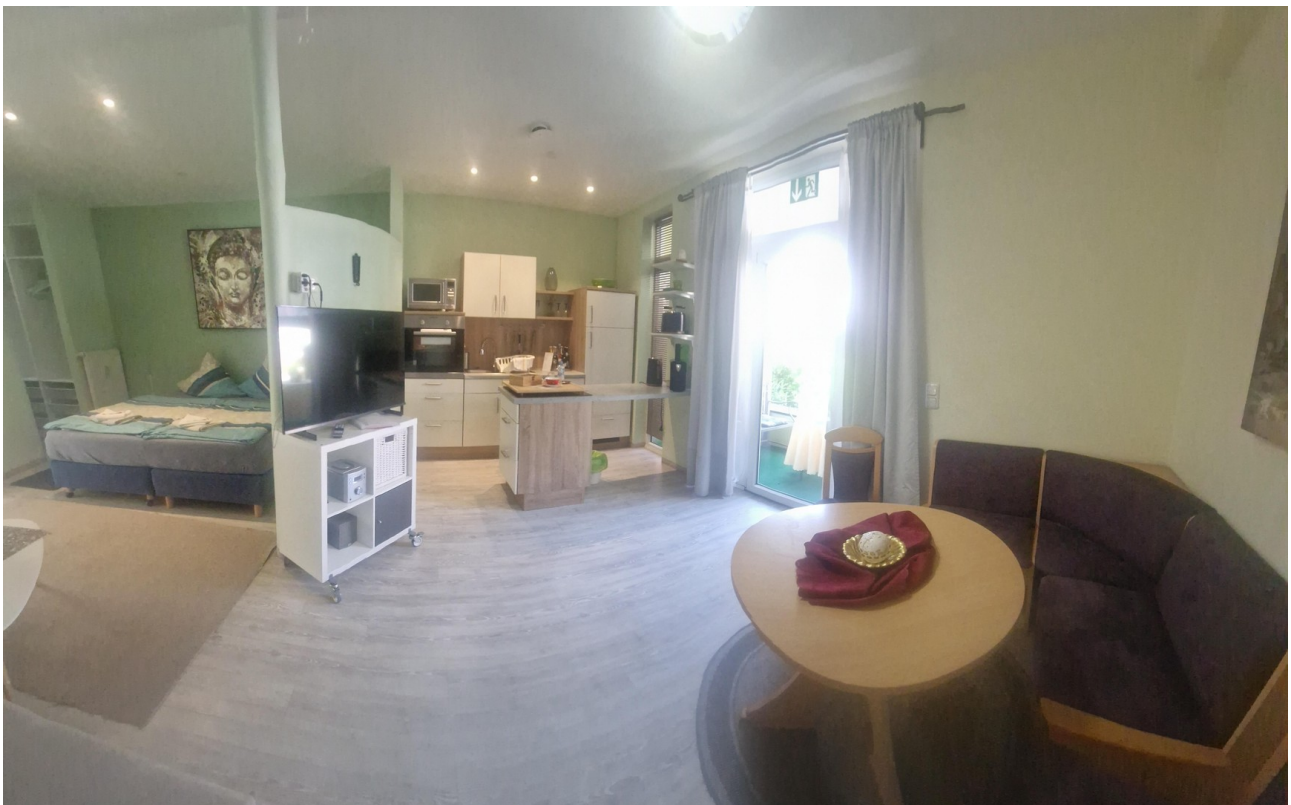
Beispiel Küche großes Apartm.