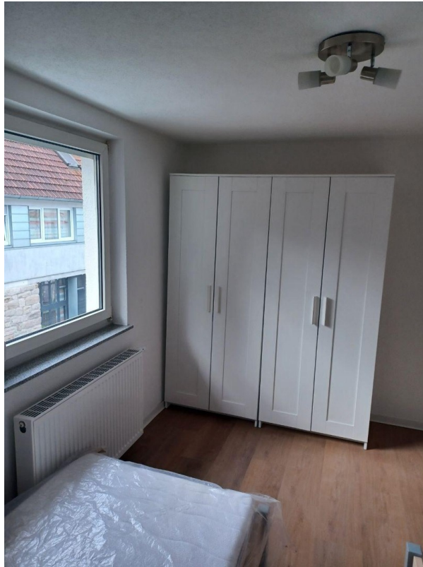
1. Zimmer neben der Küche