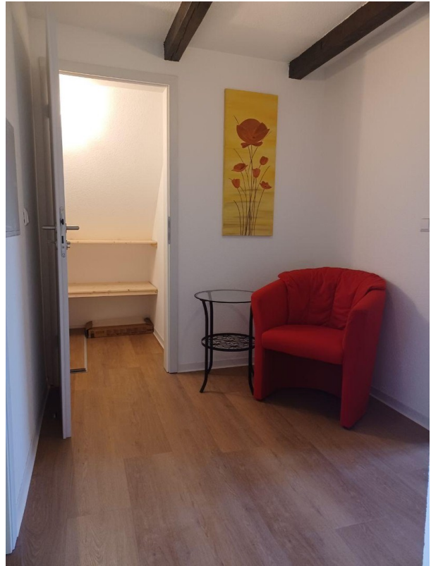
Flur DG und Abstellkammer