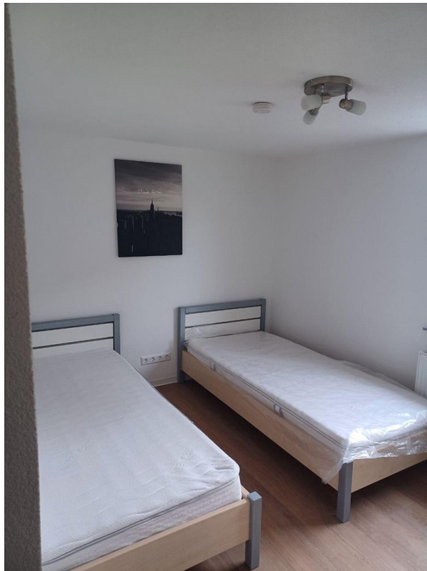
1. Zimmer neben der Küche