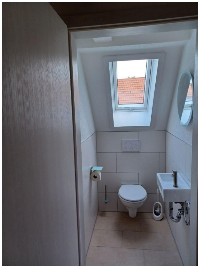
Gäste-WC im Dachgeschoss