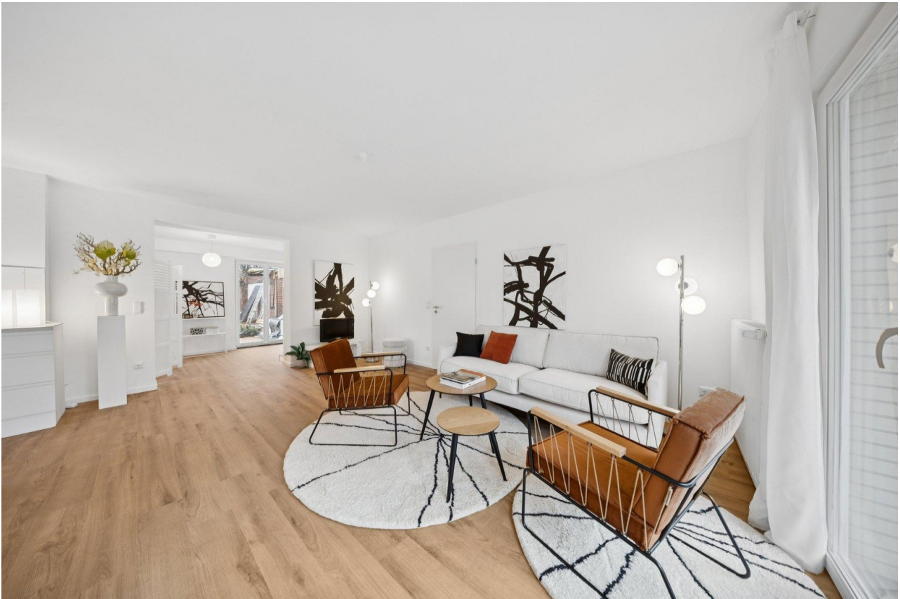
Heller Wohn-Essbereich im EG