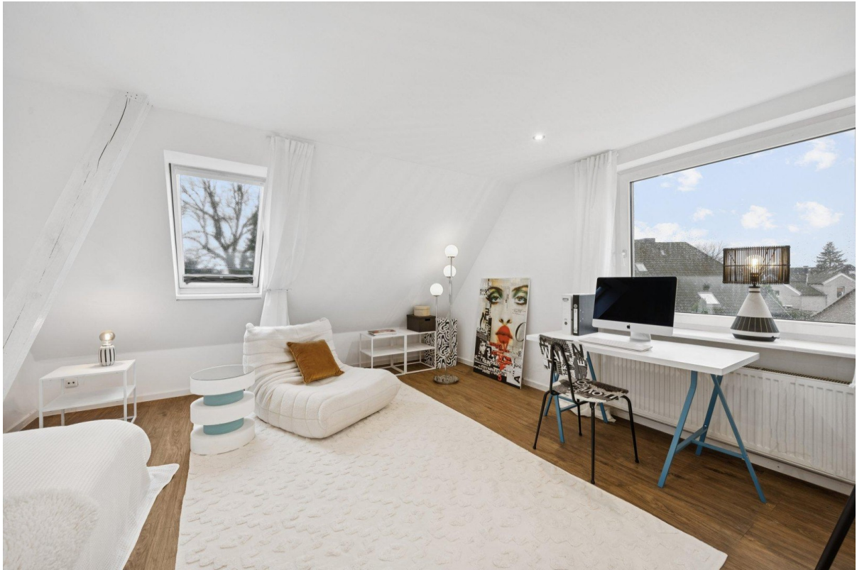
2. Schlafzimmer DG