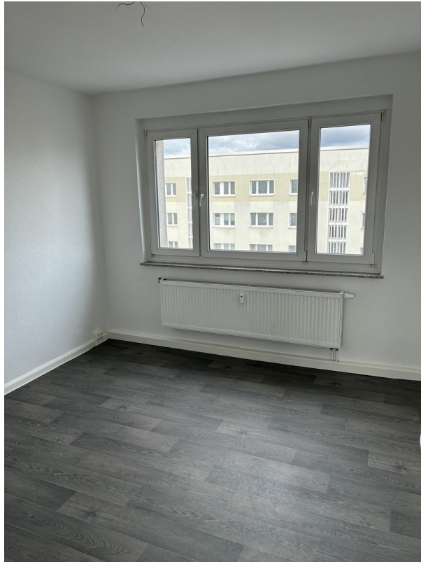
Zimmer 2 lt. Grundriss