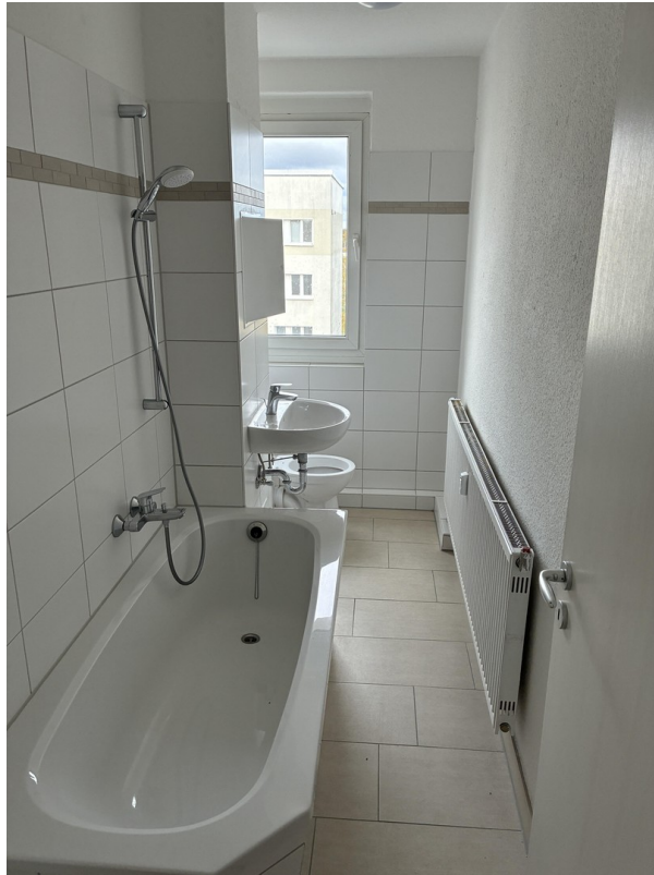
Badezimmer mit Wanne