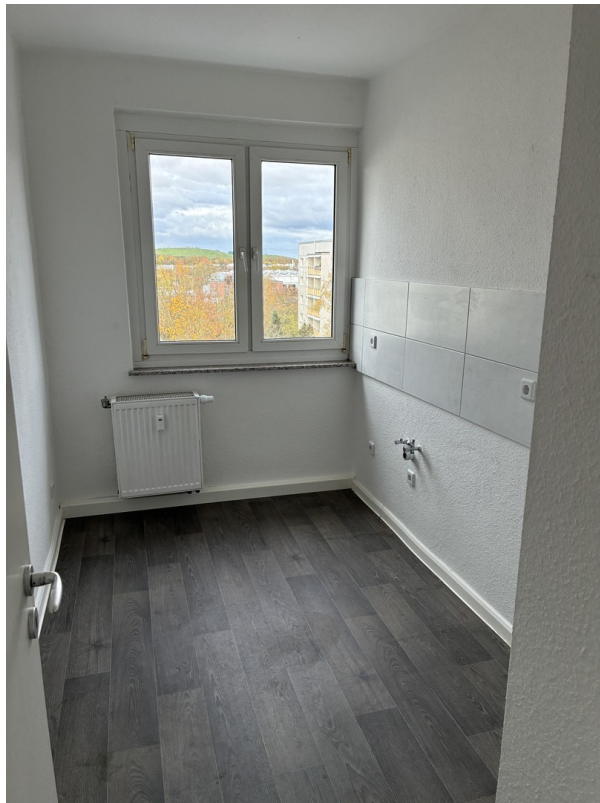
Küche, noch ohne Möbel