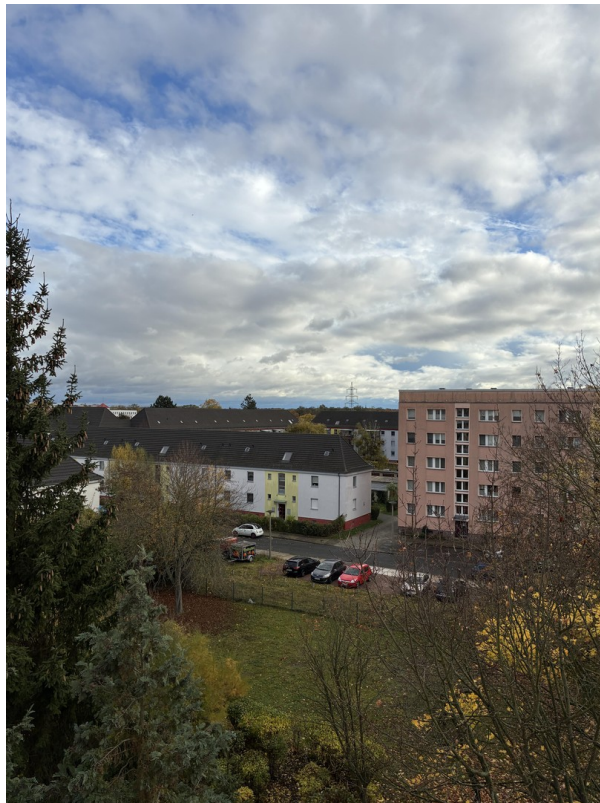
Blick nach hinten raus