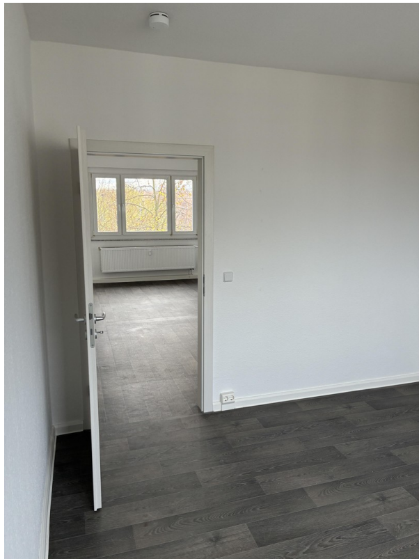
Zimmer 2 lt. Grundriss