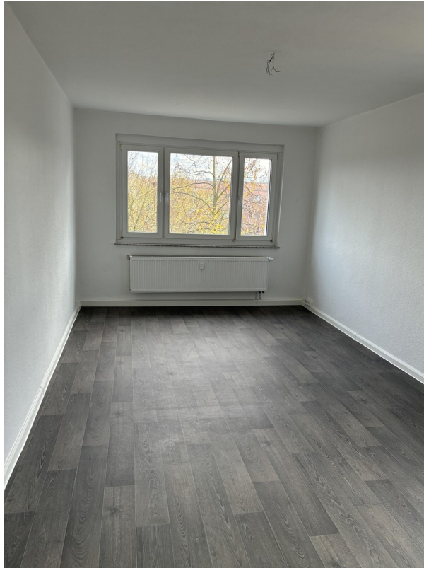
Zimmer 1 lt. Grundriss