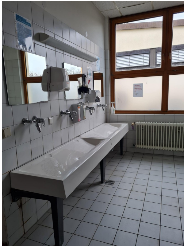
Herren WC Bereich