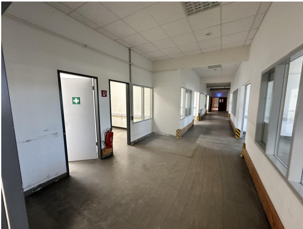
Flur zu einzelnen Räumen