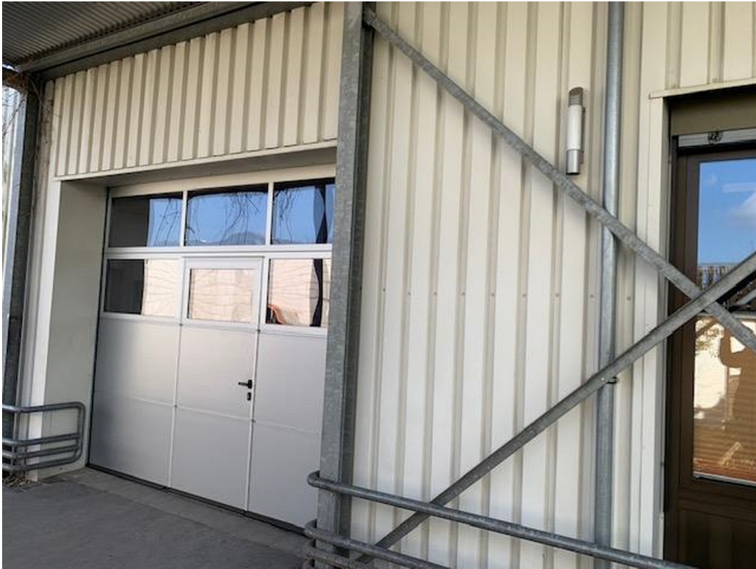
Rolltor als Zugang zur Halle