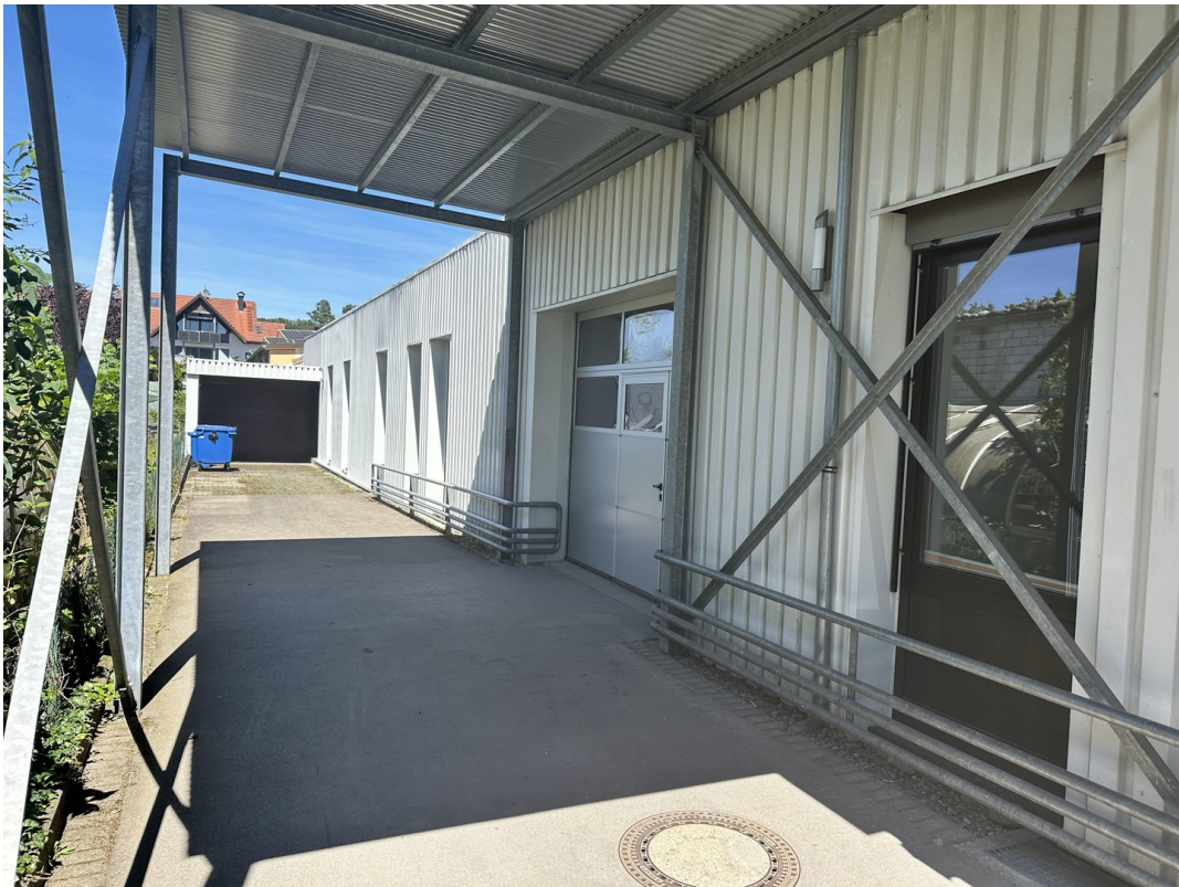
Zufahrt mit Garage und Rolltor