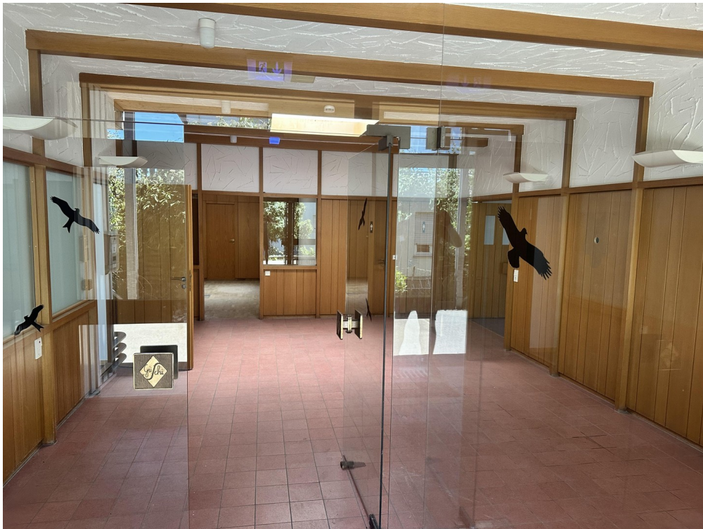
Eingangsbereich mit Büros