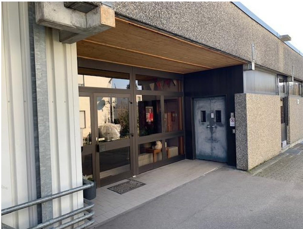
Eingangsbereich mit Aufzug