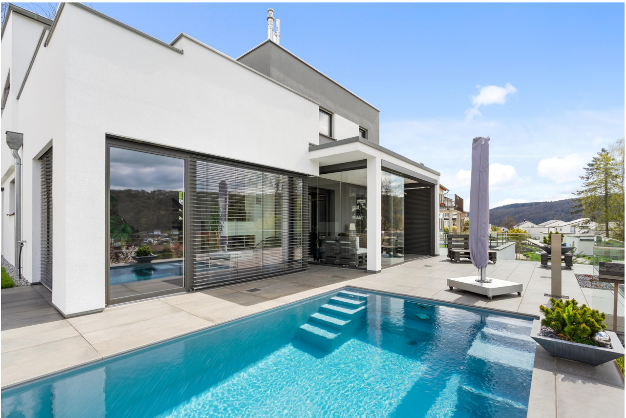
Pool mit Gegenstromanlage