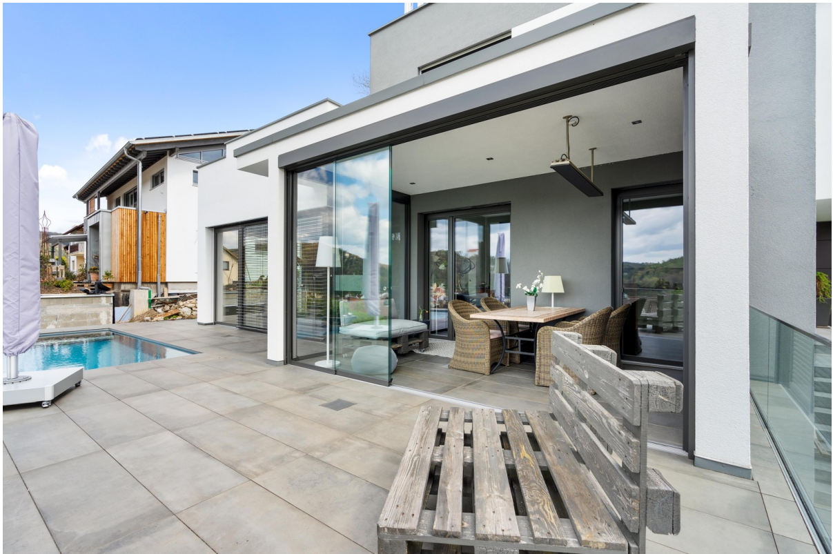
Terasse mit Sommergarten