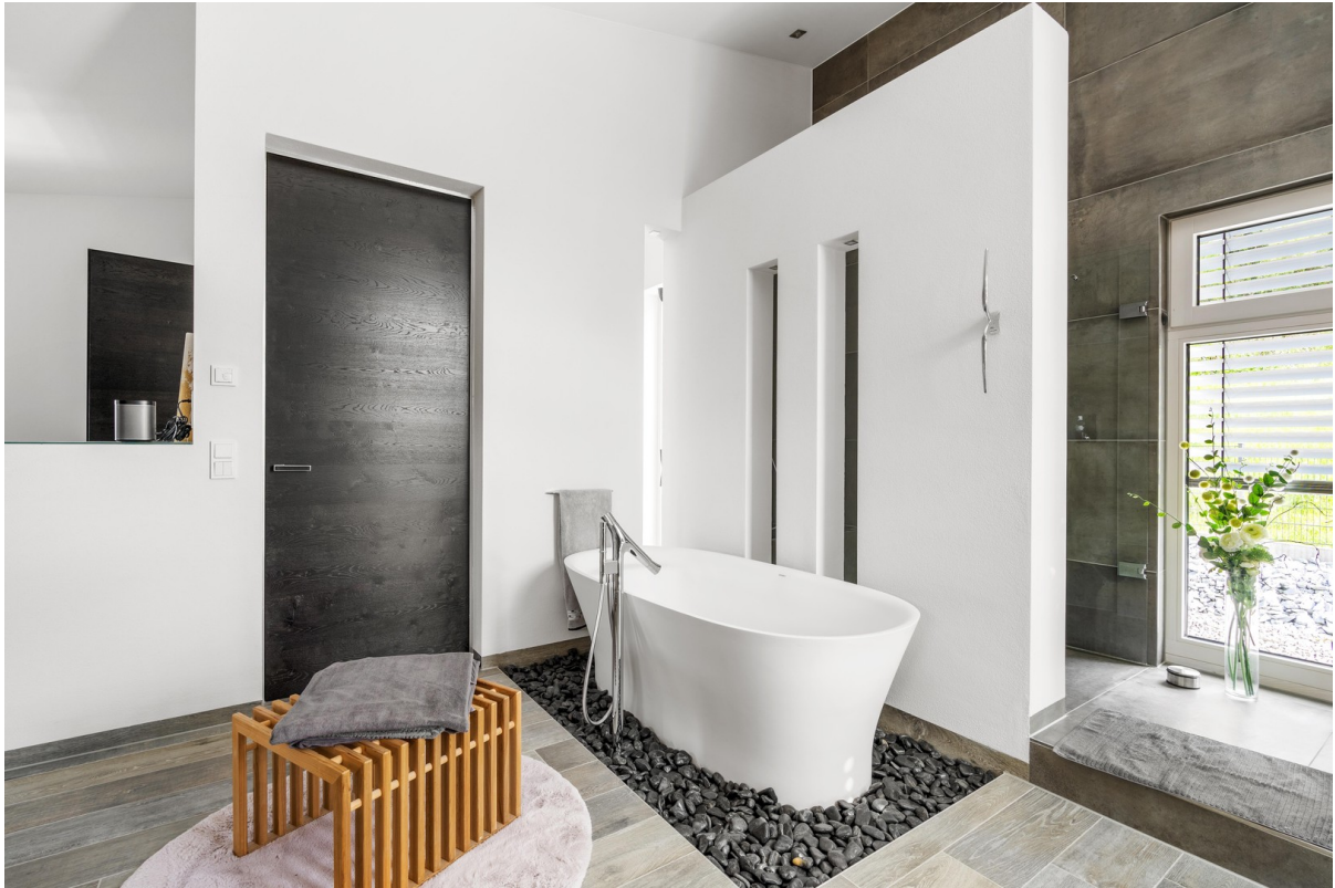
Philippe Starck Badewanne