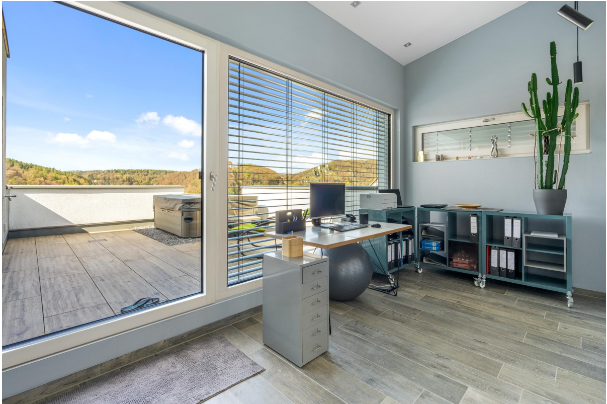
Kinderzimmer oder Büro