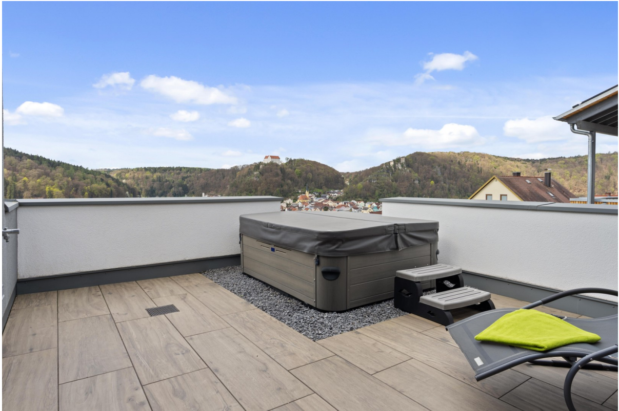
V&B Whirlpool Dachterasse