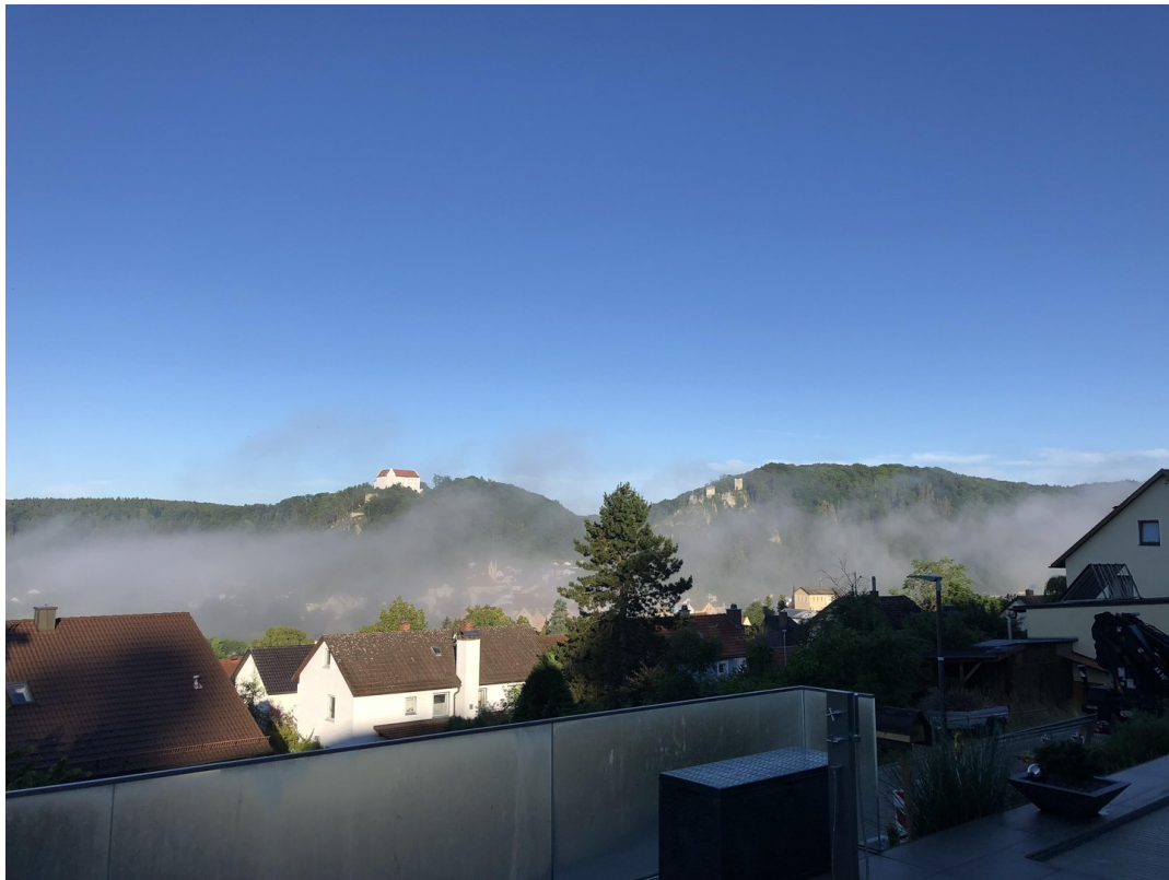
der Natur so nah