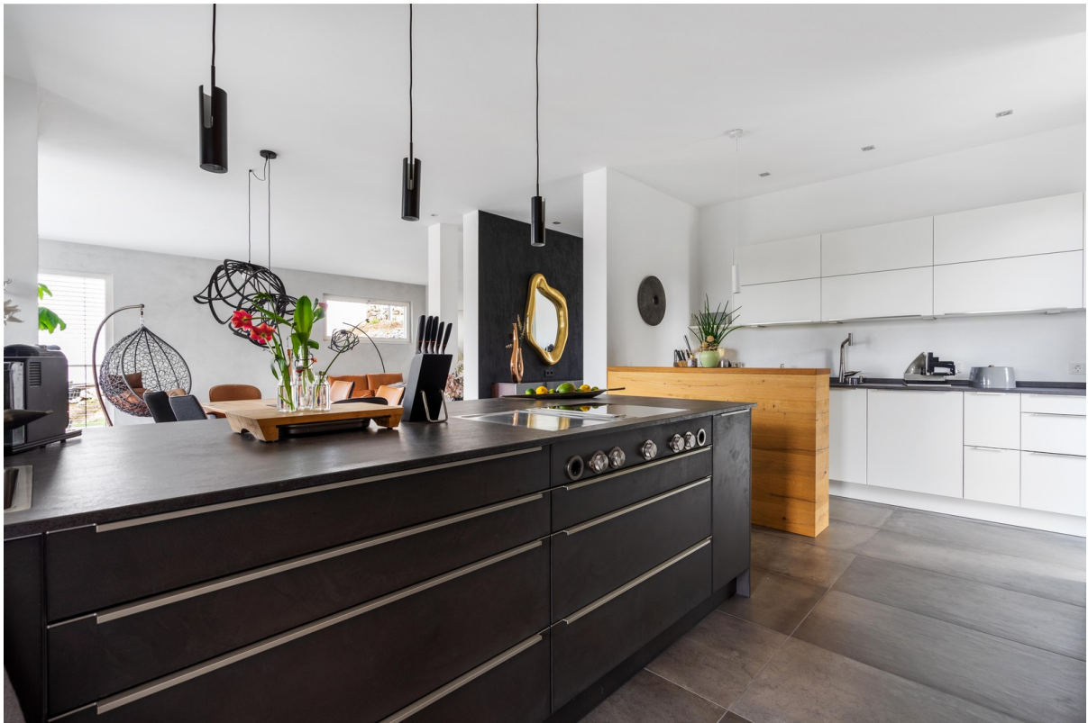
Zeyko Manufaktur Küche