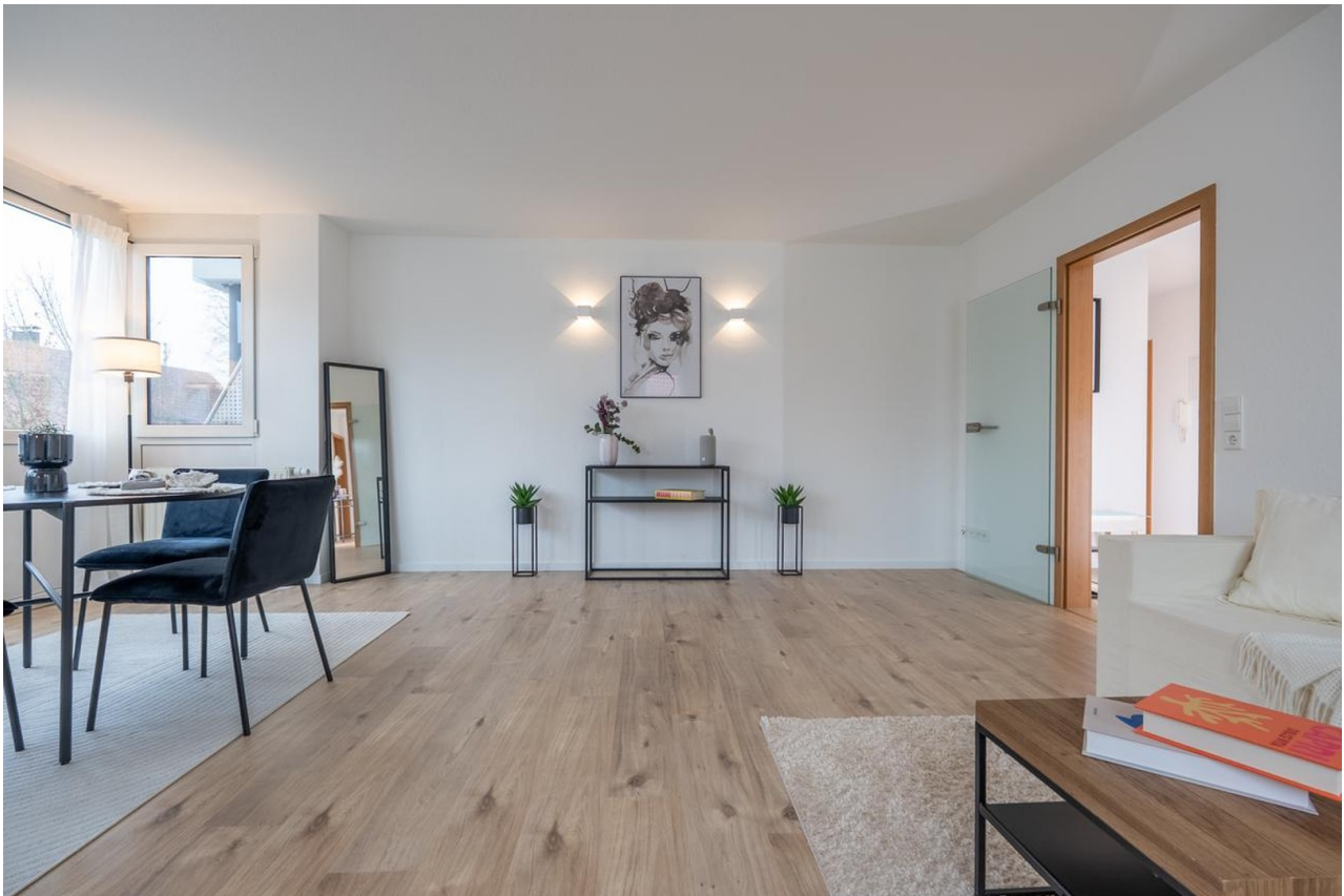
Wohn- und Esszimmer 1