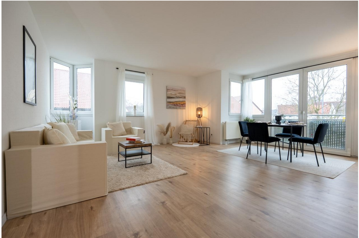
Wohn- und Esszimmer 2