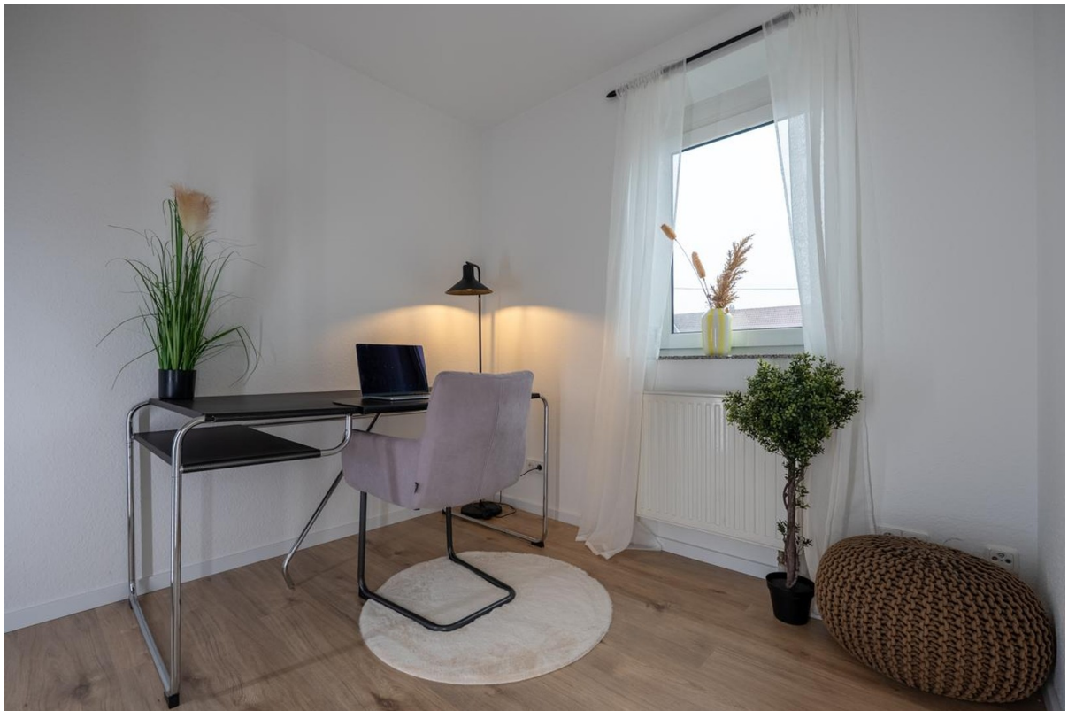
Büro oder Kinderzimmer