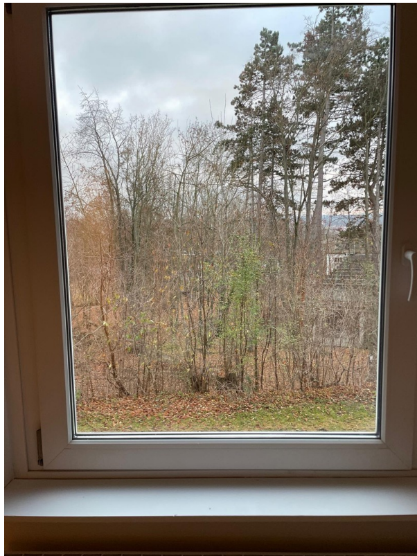
Aussicht Fenster A