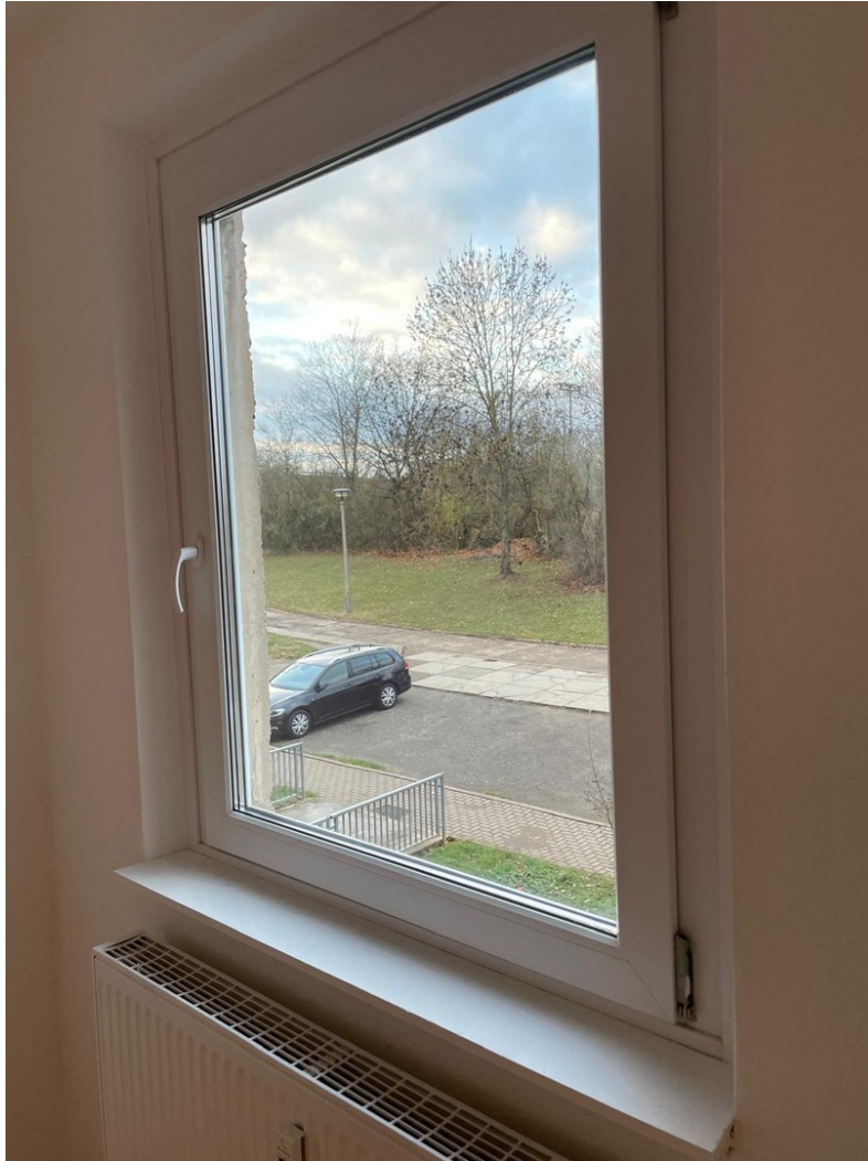
Aussicht Fenster B