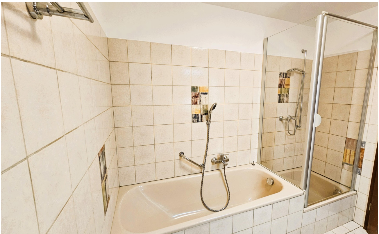
Bad & Dusche