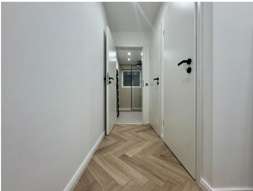
Flur mit Bad HWR und Abstellra