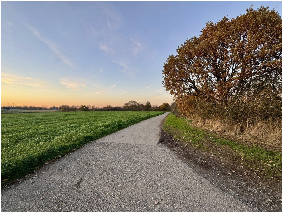
Lage am Feldrand