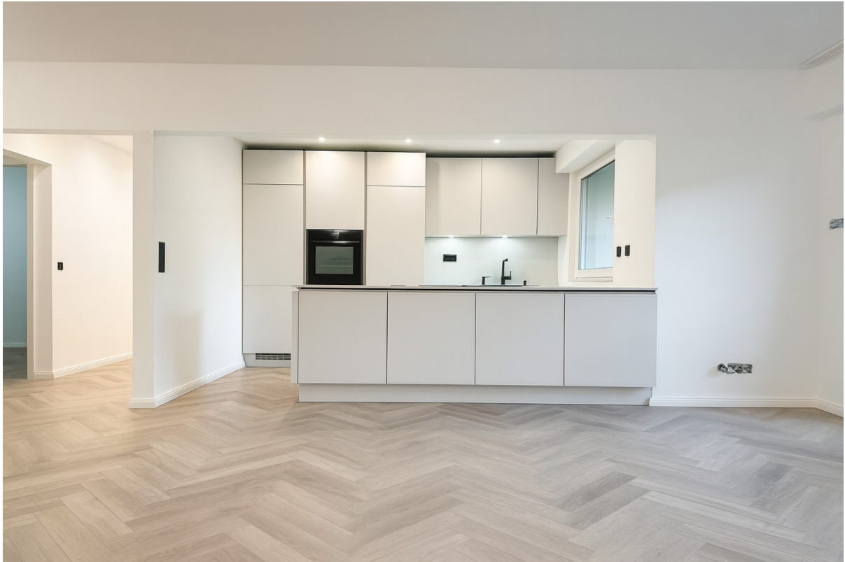
Nobilia Küche mit Neff E-Gerät