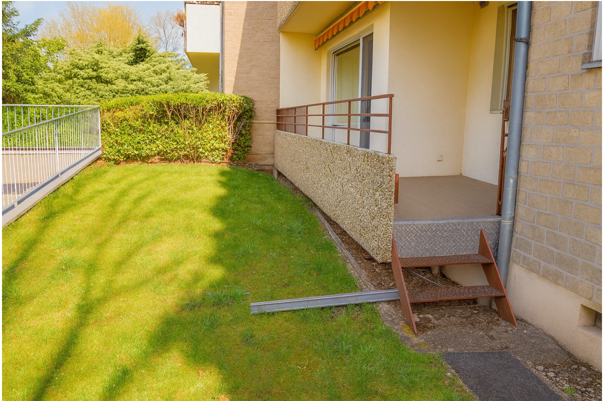
Loggia mit Zugang zum Garten