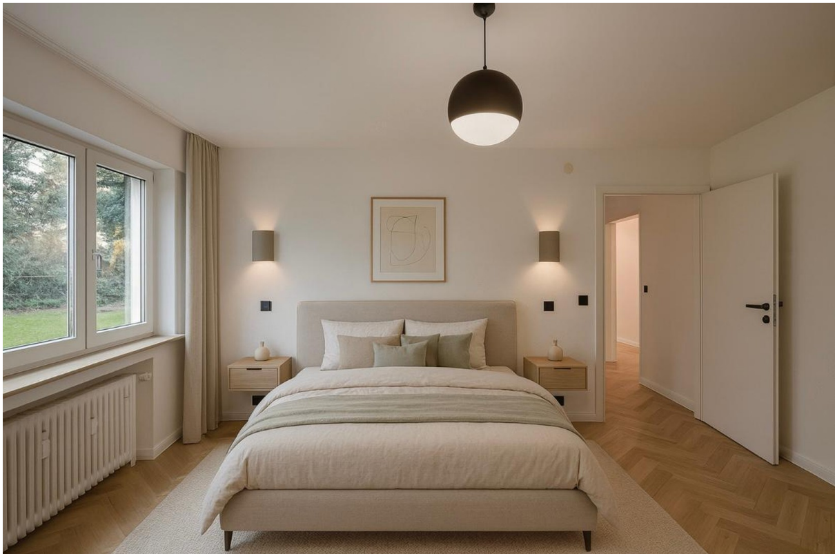
2. Visualisierung Schlafzimmer