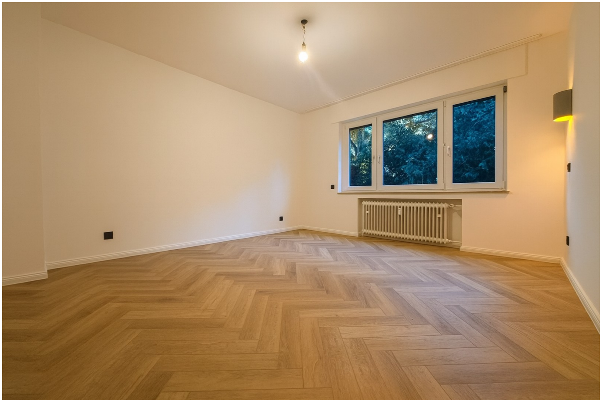
Schlafzimmer Ist-Zustand 2