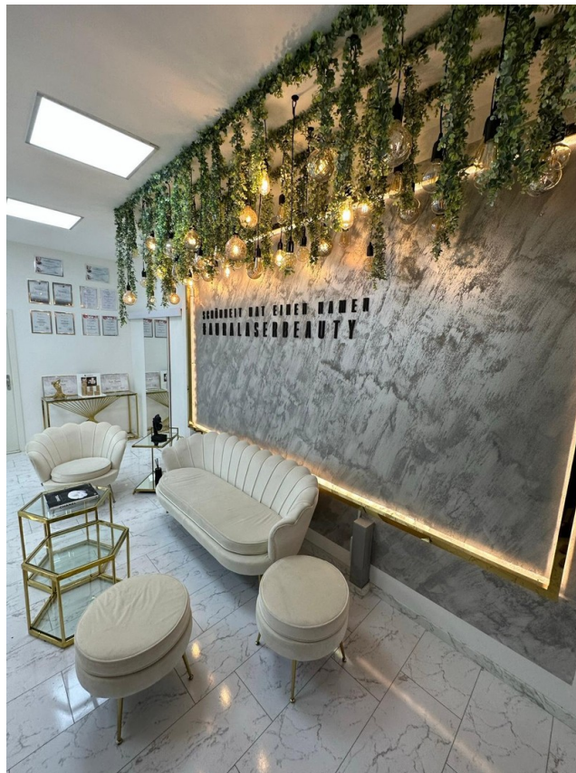
Ansicht Eingangsbereich rechts