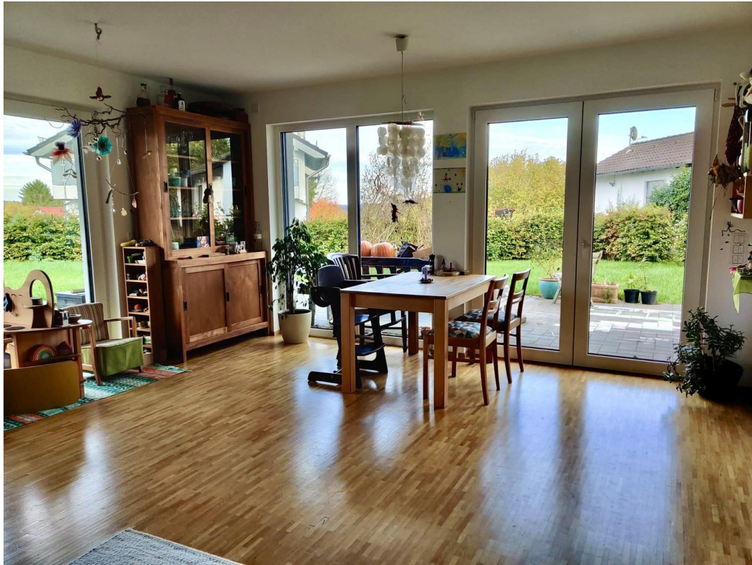
Wohnen mit Austritt