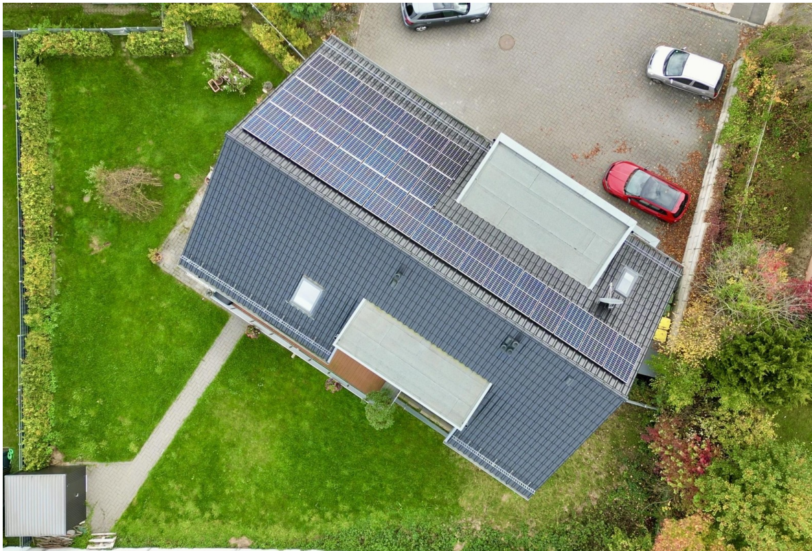
Haus von oben