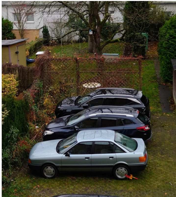
Hof mit Einstellplatz