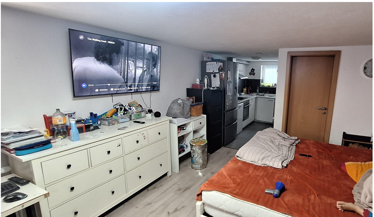
Einlieger Whg Küche/ Wohn