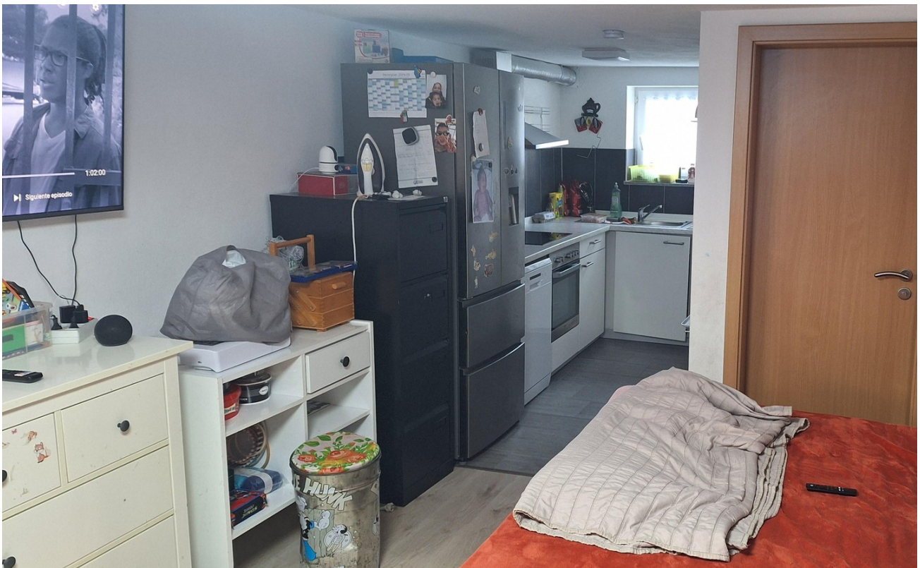
Einlieger- Küche/ Wohn