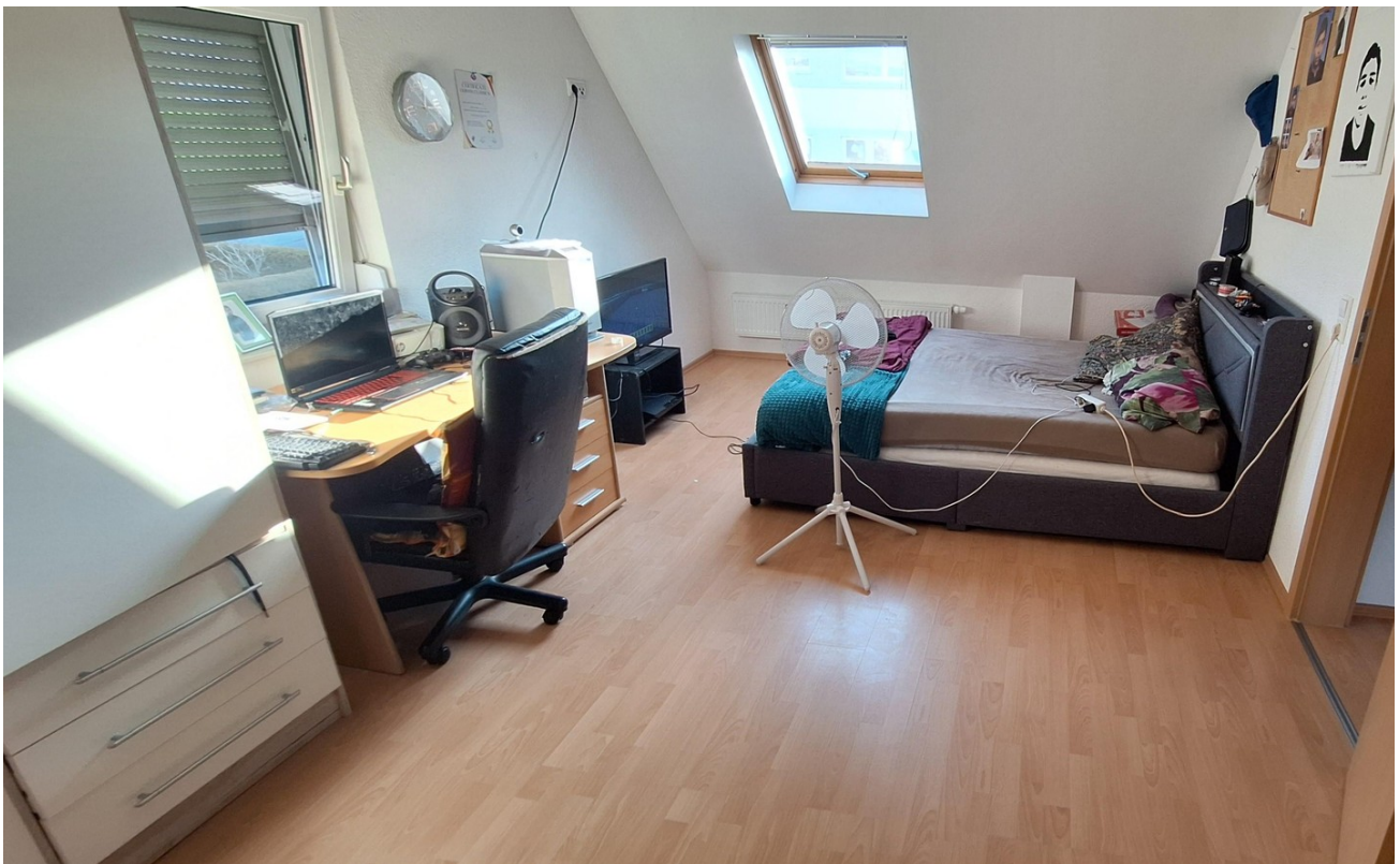
OG Schlaf 2