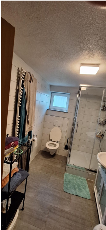
Einlieger- Whg Bad 1