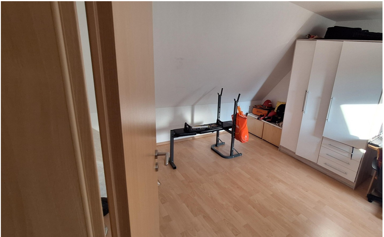
OG Schlaf 1