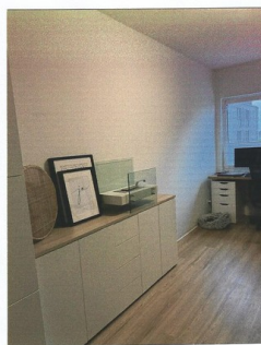
Kleines Zimmer, Büro o.ä.