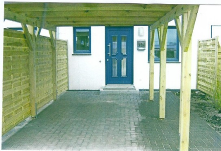
Eingang mit Carport