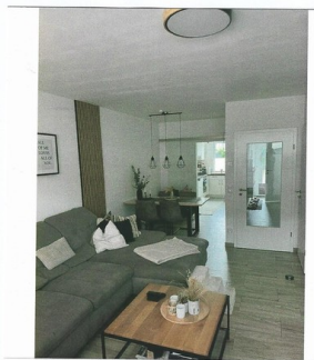
Wohnzimmer mit Blick zur Essecke und zur Küche