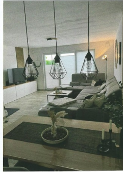
Wohnzimmer mit Blick zur Terrasse