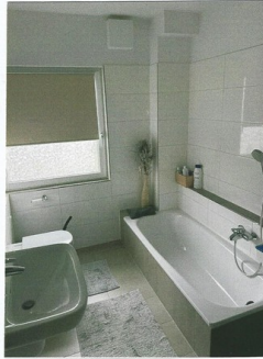
Vollbad mit Dusche und Waschtisch